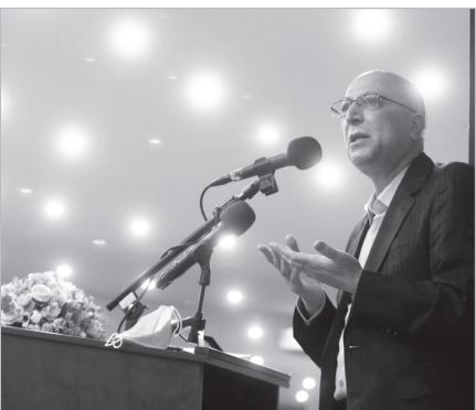
می‌سازند تا در راستای افزایش کارآمدگی دانشجویان بتوانیم گام مؤثری برداریم. وزیر علوم، تحقیقات و فناوری یادآور شد: در این طرح به ازای هر دانشجو مبلغ یک میلیون تومان اختصاص می‌دهیم و خوش‌یخانه وزارت صنعت، معدن

ایرنا | وزیر علوم، تحقیقات و فناوری گفت: در طرح ملی ترویج کارآفرینی در حمایت از دانشگاه‌ها مبلغ یک میلیون تومان به ازای هر دانشجو اختصاص داده می‌شود. محمدعلی زلفی‌گل در آیین آغاز به کار طرح ملی ترویج کارآفرینی در پارک علم و فناوری دانشگاه امیرکبیر افزود: یکی از برنامه‌های وزارت علوم، تحقیقات و فناوری حرکت در راستای تبدیل علوم به فنون، خلق ثروت و مهارت‌افزایی در آموزش‌های دانشگاهی است. در این راستا چند طرح جدید رونمایی شده که یکی از آنها طرح ملی ترویج کارآفرینی است که در این طرح از دانشگاه‌ها حمایت مالی می‌شود تا دانشجویانی که علاقمند هستند در این طرح شرکت کنند و با ثبت‌نام و حضورشان از آموزش‌های لازم در عرصه کارآفرینی بهره‌مند شوند.