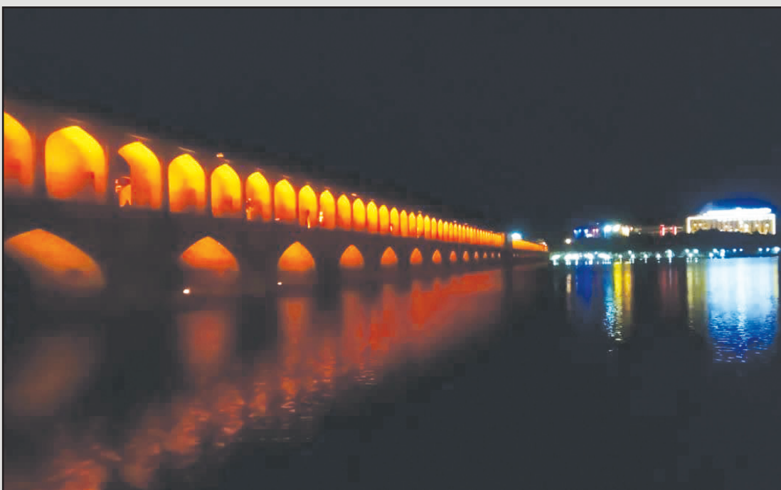
■ شب های زیبای زاینده رود پر آب ■ عکاس: عباس امیری