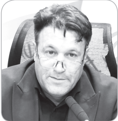
برنامه‌ریزی برای ورود ۱۰ دستگاه مینی‌بوس در ماه‌های آینده انجام شده است.

وی ادامه داد: در حوزه عمرانی، عملیات پیاده‌وسازی در معابر مختلف شهر در حال اجراست و پروژه‌های متعددی با وجود شرایط دشوار اقتصادی فعال هستند.