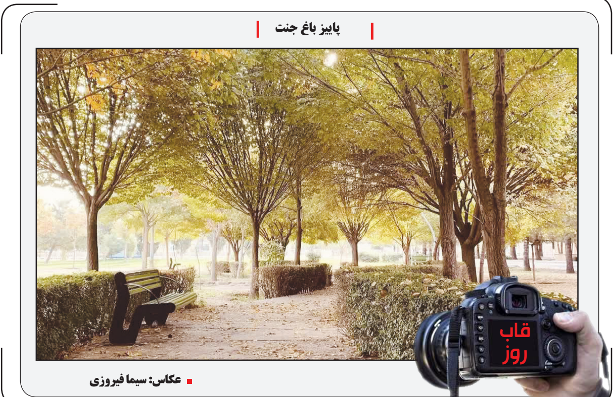
بایز باغ جنت

نیمه اول، علیرغم برتری نسبی کره‌ای‌ها، با تساوی بدون گل به پایان رسید؛ نیمه دوم اما داستانی متفاوت داشت. چک پس از پنج دوره غیبت، به جام جهانی بازگشته بود و به گل برتری هم رسیده، اما کره علیرغم مالکیت بیشتر (۶۲ درصد)، فرصت‌های کمتری به دست می‌آورد. در دقیقه ۵۹، لادیسلاف کرجیچ با یک ضربه سر، روی پرتاب اوت و لادیمیر کوفال، چک را جلو انداخت، اما چشم‌بادامی‌ها خیلی سریع واکنش نشان دادند و تنها ۸ دقیقه بعد، در دقیقه ۶۷، هوانگ این-یوم با یک سر توپ زیبا و چیب دقیق از داخل محوطه جریمه، بازی را به تساوی کشاند؛ اوج نمایش کره در دقیقه ۸۰ رقم خورد. تعویض طلایی هوانگ میونگ-بو، با ورود اوه هیون گیو به جای سون افسانای، پایه‌گذاری برتری سرخپوشان کره شد. ضربه دقیق گیو، روی پاس در عرض هوانگ، گل برتری را برای کره جنوبی به ارمغان آورد. چک، در دقیقه پایانی فرصت‌هایی برای تساوی داشت، اما کیم سوونگ گیو با واکنش‌های به موقع خود، دروازه کره را حفظ کرد تا اولین کامبک جام در دومین مسابقه، توسط یک تیم آسیایی رقم بخورد.