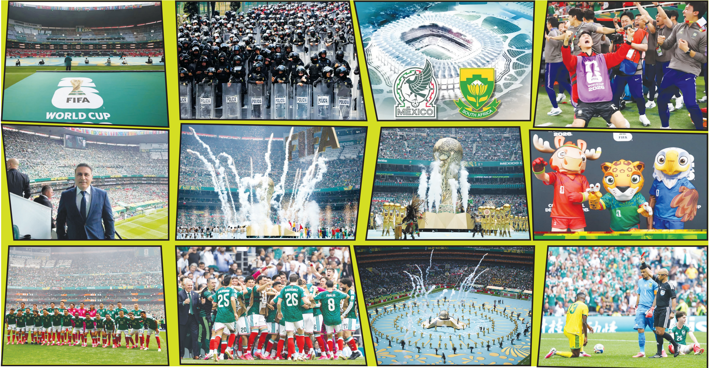
مهدوی کیا، شکیرا، گل، اخراج و مرگ