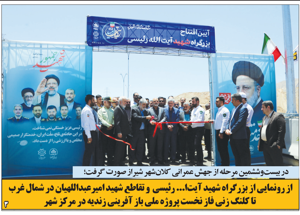
در بیست و ششمین مرحله از جهش عمرانی کلان شهر شیراز صورت گرفت؛

از رونمایی از بزرگراه شهید آیت... رئیسی و تقاطع شهید امیر عبداللهمان در شمال غرب تا کلنگ زنی فاز نخست پروژه ملی باز آفرینی زندیه در مرکز شهر