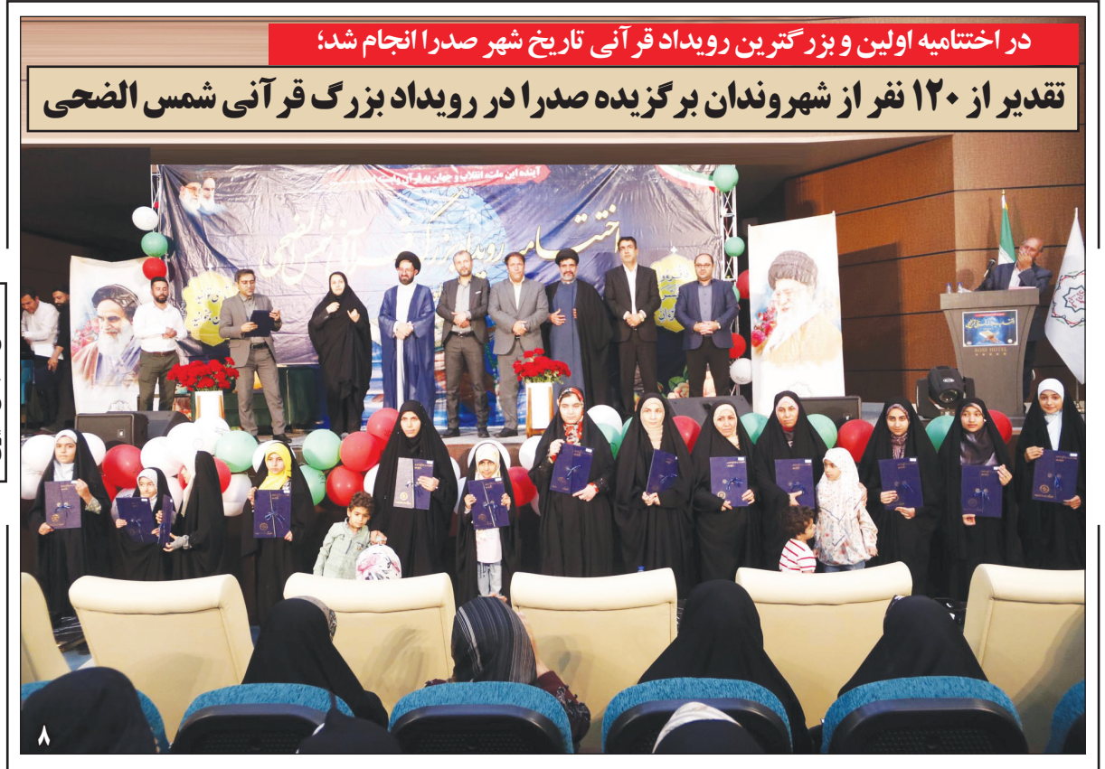
در اختتامیه اولین و بزرگترین رویداد قرآنی تاریخ شهر صدرا انجام شد؛

از رونمایی از بزرگراه شهید آیت... رئیسی و تقاطع شهید امیر عبداللهمان در شمال غرب تا کلنگ زنی فاز نخست پروژه ملی باز آفرینی زندیه در مرکز شهر