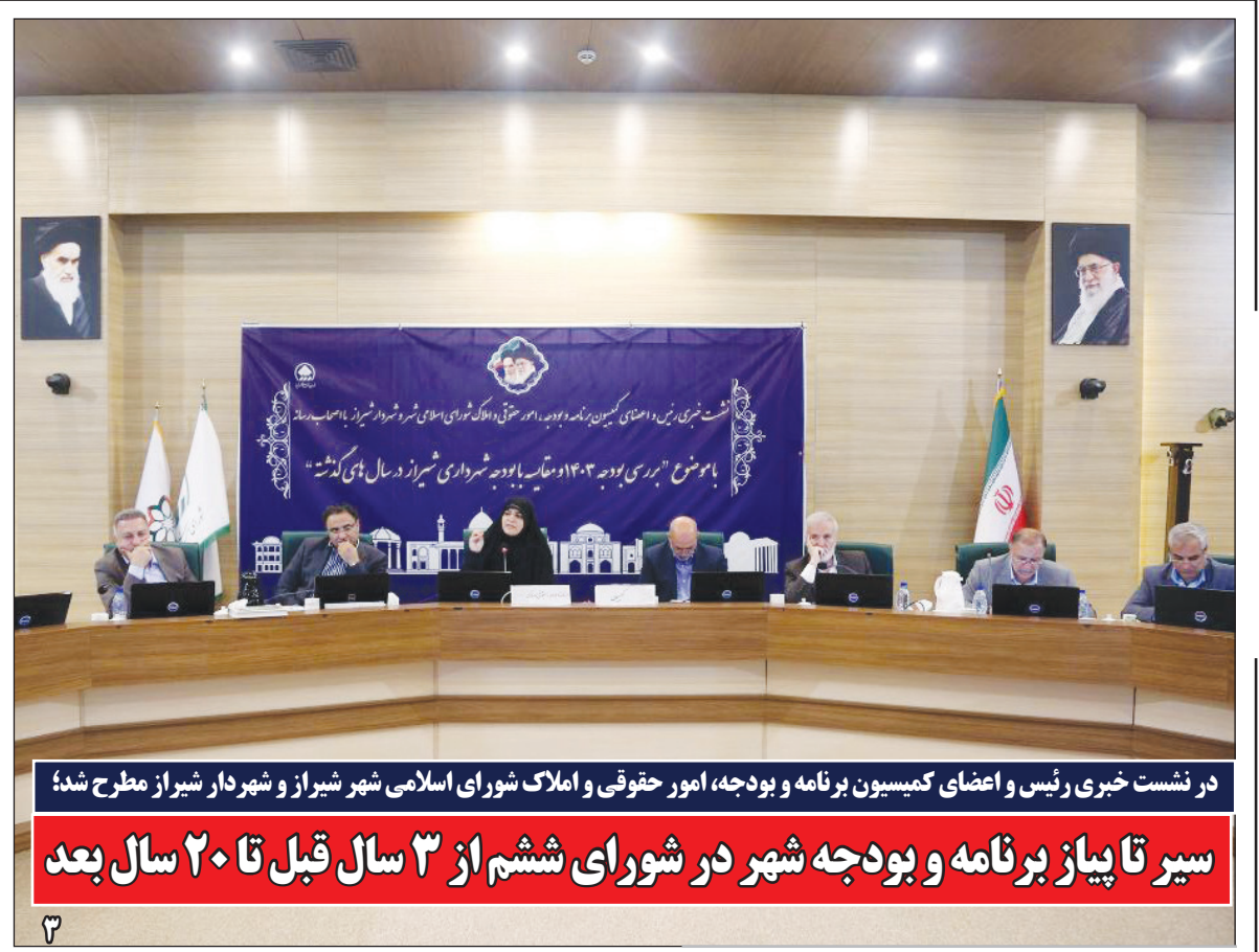
در نشست خبری رئیس و اعضای کمیسیون برنامه و بودجه، امور حقوقی و املاک شورای اسلامی شهر شیراز و شهردار شیراز مطرح شد:

رونمایی از ۱۶ خودرو تولید داخل در نمایشگاه بین المللی فارسی