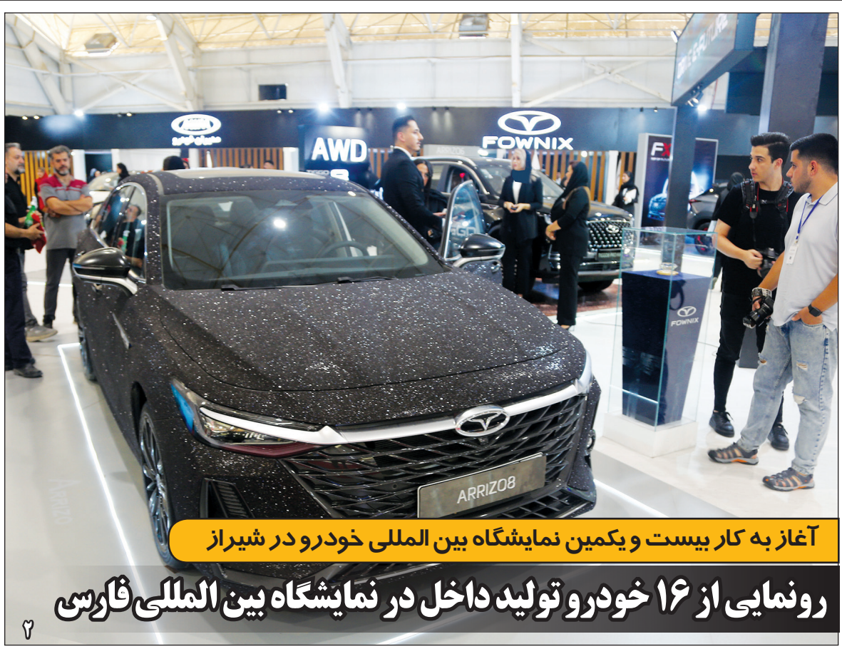
آغاز به کار بیست و یکمین نمایشگاه بین المللی خودرو در شیراز

رونمایی از ۱۶ خودرو تولید داخل در نمایشگاه بین المللی فارسی