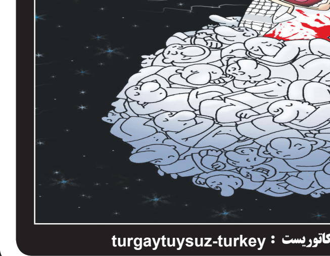
کاریکاتور نیست : turgaytuysuz-turkey

بازیکنان جوان آنها را به عنوان برادر بزرگتر می بینند. ما یک تیمی هستیم که همه با هم رفقت داریم، این مردم لیاقتشان بیشتر از این حرف ها است.