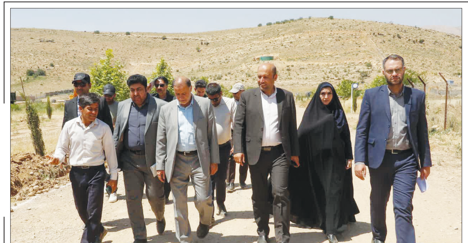
در جلسه این هفته کمیسیون سلامت، محیط زیست و خدمات شهری شورای شهر شیراز مطرح شد؛