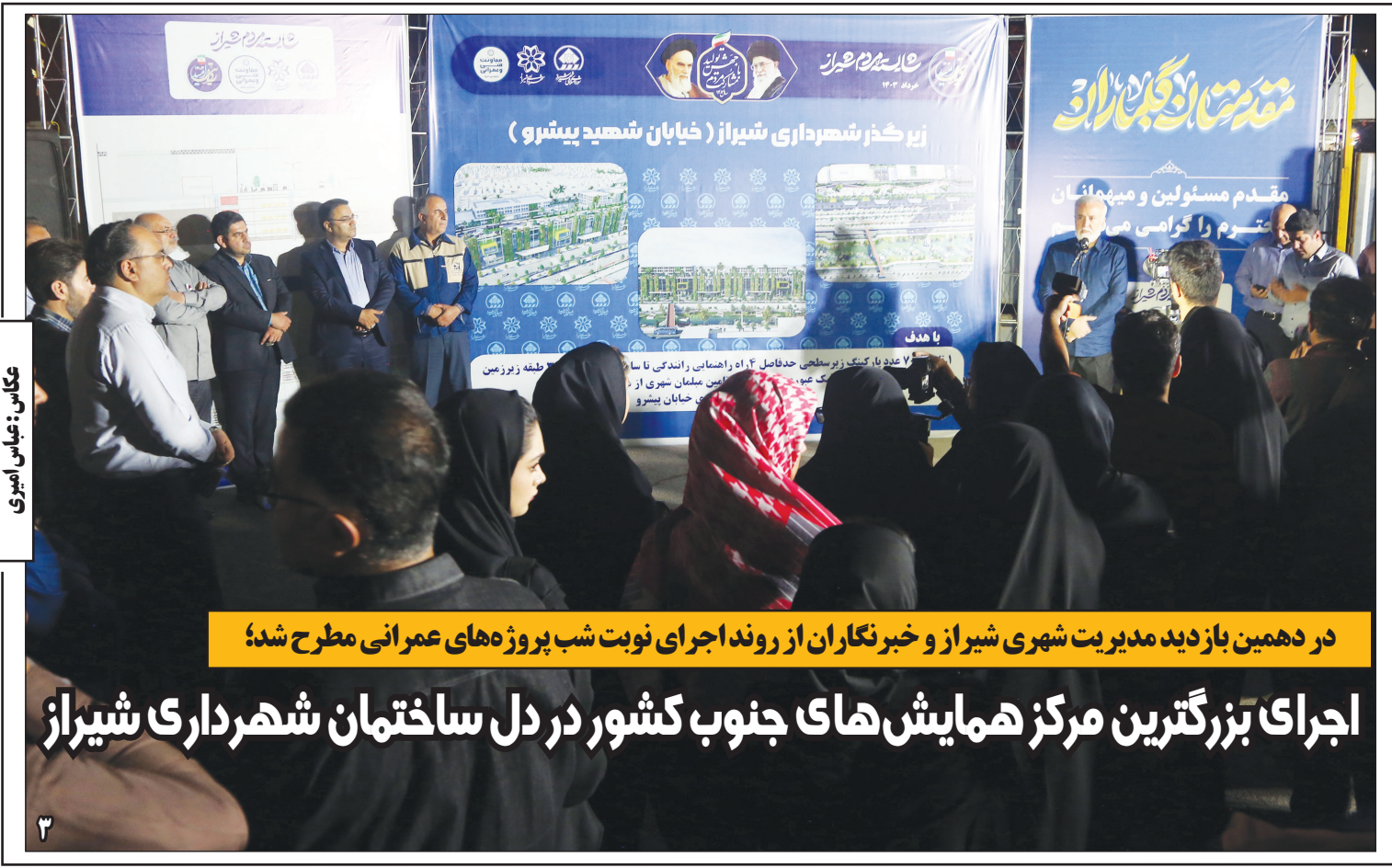
در دهمین یازدهمین دیدار مدیریتی شهری شیراز و خبرنگاران از روند اجرای نوبت شب پروژه‌های عمرانی مطرح شد؛ اجرای بزرگترین مرکز همایش‌های جنوب کشور در دل ساختمان شهرداری شیراز

پیشکسوتان و هنرمندان نوآور صنایع دستی تجلیل شدند