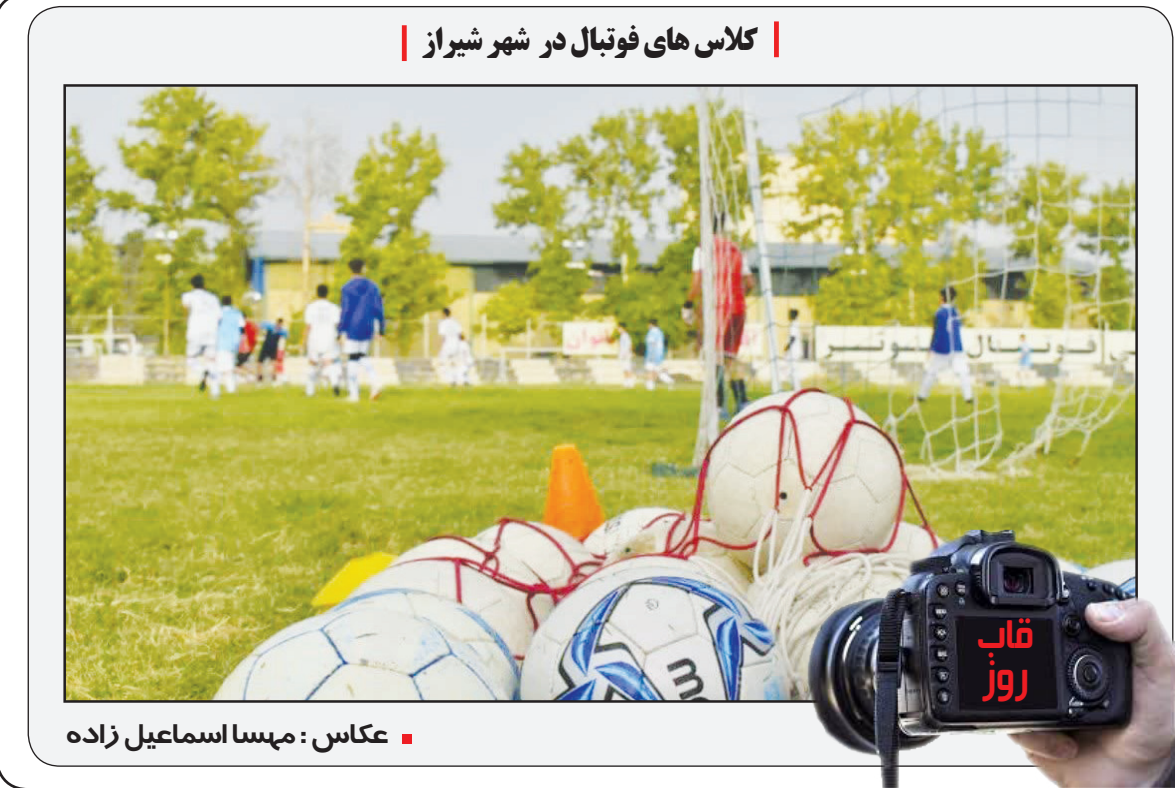
کلاس های فوتبال در شهر شیراز