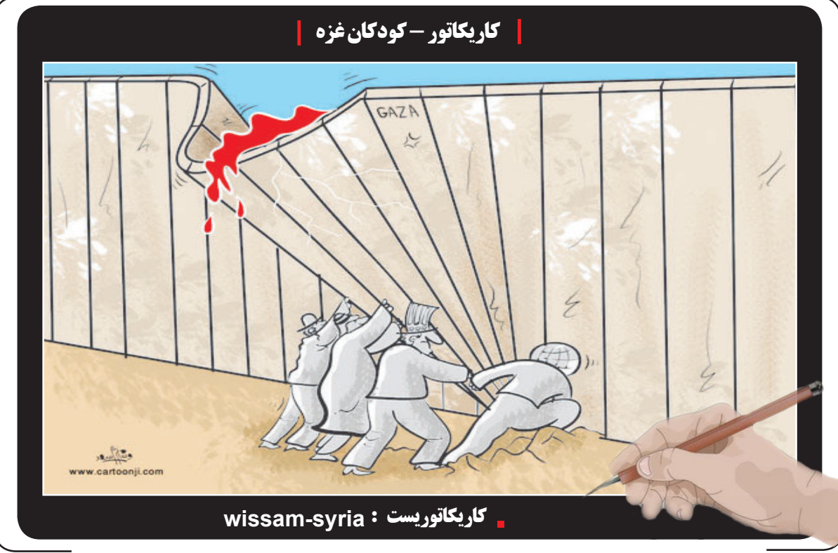
کاریکاتور - کودکان غزه

هاشمی: راه رئیس جمهور مردمی ادامه می یابد نشتت و بیباری کیومرث هاشمی با روسای فدراسیون های ورزشی با عنوان «حماسه خدمت بدون وقفه باقیست» در محل وزارتخانه برگزار شد. وزیر ورزش و جوانان در این نشست با عرض تسلیت در بی شهادت سید ابراهیم رئیسی، رئیس جمهور و هیات همراه وی در سانحه ناگوار سقوط بالگرد اظهار داشت: همانطور که رهبر انقلاب فرمودند که در امور کشور هیچ خللی ایجاد نمی شود، ما نیز وظیفه داریم در راستای مأموریتی که داریم به بهترین شکل کارها را پیش ببریم. این قول را به شهدا دادیم که همین منشی را ادامه دهیم و از همین جا خدمت آیت الله رئیسی این قول را می دهیم و به تاسی از این بزرگ مرد، راه رئیس جمهور مردمی را ادامه می دهیم. وی ادامه داد: رئیس جمهور شهید همواره تاکید داشتند هر کاری که می کنید باید رضایت و خشنودی مردم را در پی داشته باشد و اعتقاد داشتند که خدمت به مردم بالاترین عبادت است. وظیفه داریم که اسلحه روی زمین نماند و بر اساس منویات رهبر انقلاب به اهدافمان برسیم. مثل گذشته باید کار را انجام دهیم و بتوانیم با یک کار جهادی دل مردم را شاد کنیم. وزیر ورزش و جوانان اضافه کرد: فدراسیون ها در بحث برگزاری مسابقات طبق برنامه