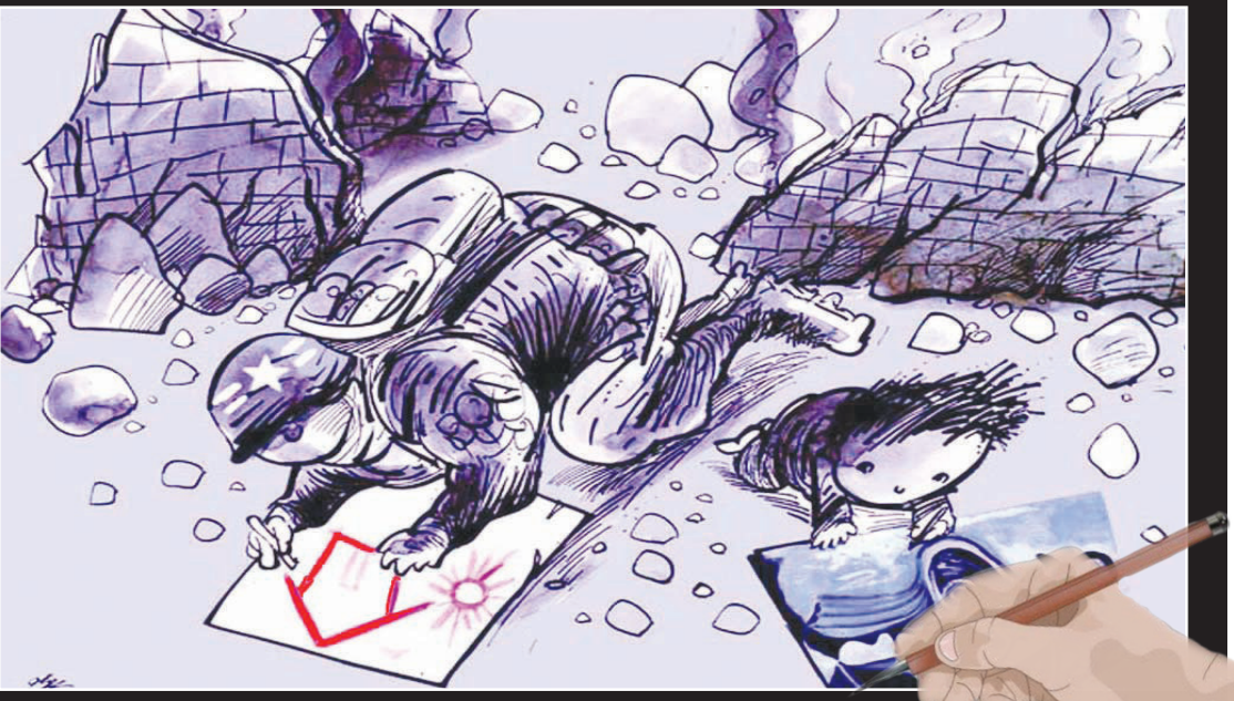
کاریکاتور است: Oğuz Gürel - Türkiye