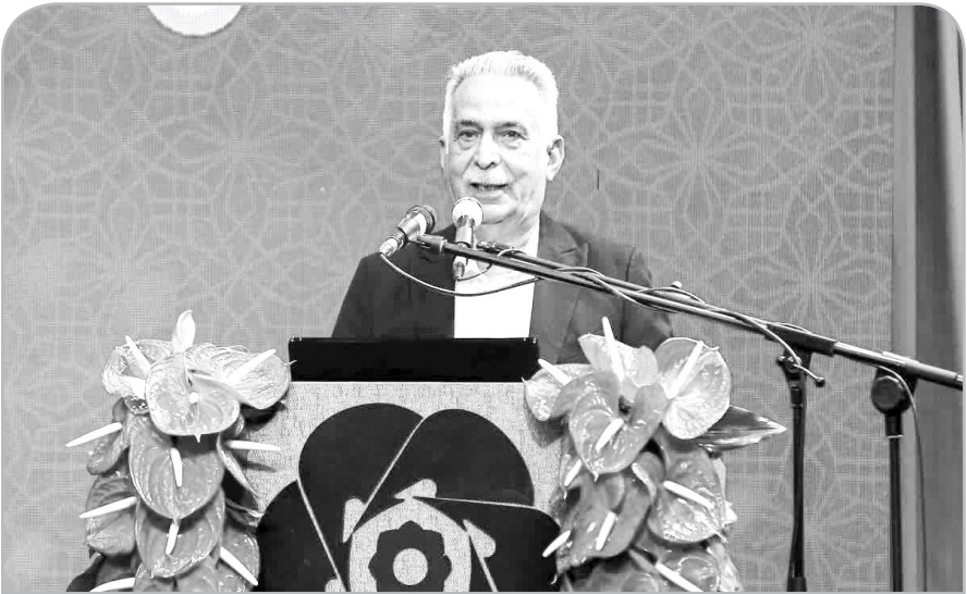
او ضمن تقدیر از دبیرکل مجمع گفتگوی همکاری آسیا (ACD)، روسا و نمایندگان اتاق های بازرگانی، پژوهشگران