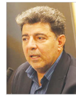
مدیر کل بنیاد مسکن فارس:

بیش از ۲۰۰۰ پروژه در شهرداری شیراز فعال است