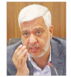
مدیر عامل شرکت عمران صدرا:

فرصت های بی بدیلی از محل نهضت ملی مسکن برای توسعه و تأمین مسکن متقاضیان فراهم شده است