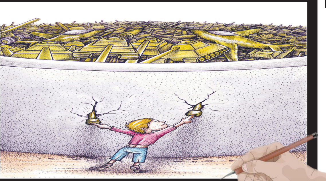
کاریکاتوریست: محمد حسین اکبری - ایران