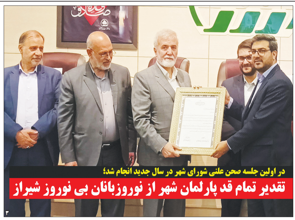
در اولین جلسه صحن علنی شورای شهر در سال جدید انجام شد؛

تقدیر تمام قد پارلمان شهر از نوروژ بانان بی نوروژ شیراز