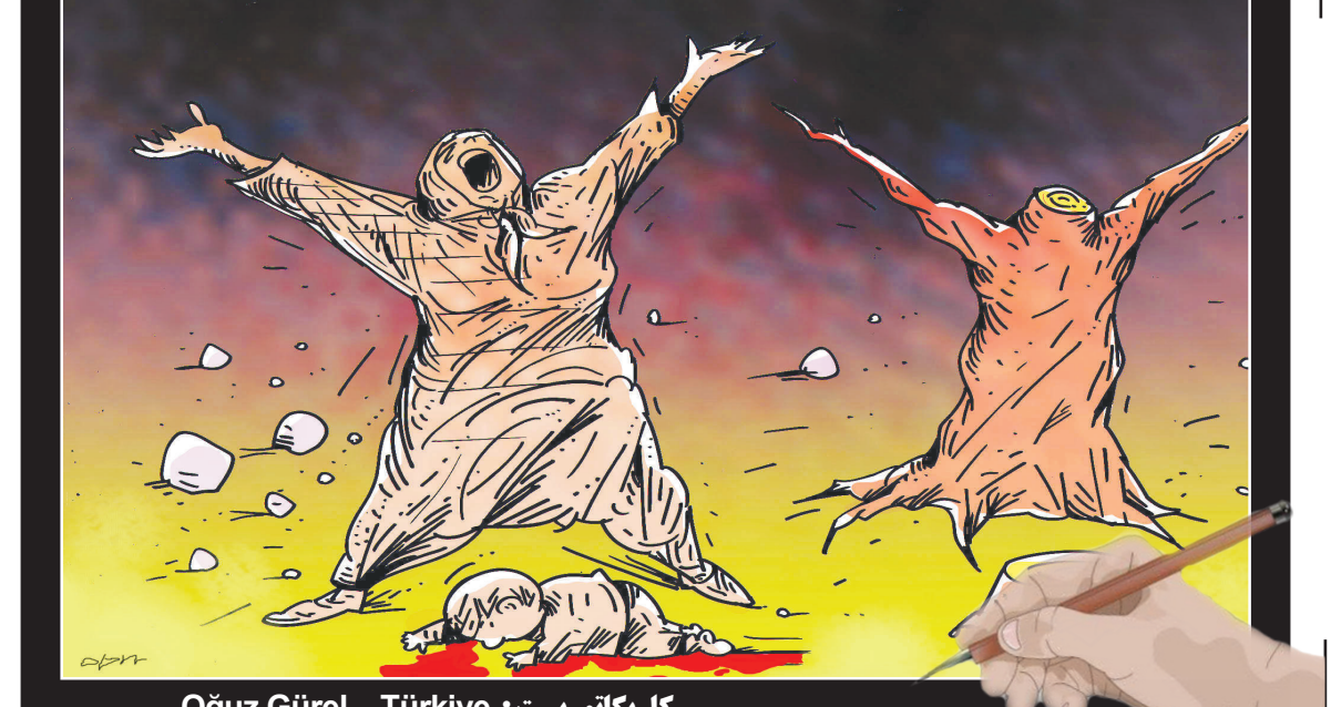
کاریکاتور نیست: Türkiye _ Oğuz Gürel