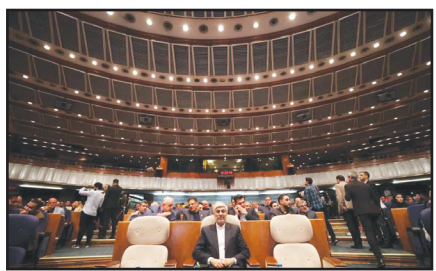
مراسم اختتامیه جشنواره قهرمان ایران از لحظاتی پیش با کیومرث هاشمی حضور وزیر ورزش و جوانان، روسای فدراسیون های ورزشی، قهرمانان و افتخار آفرینان کشور و جامعه

ورزش در مرکز همایش های صدا و سیما آغاز شد. قرار است در این مراسم، بهترین های سال گذشته ورزش ایران در بخش های مختلف، انتخاب و معرفی شوند. در حاشیه این مراسم بحث واگذاری دو باشگاه استقلال و پرسپولیس باغ و پیشکسوتان فوتبالی در گفتگو با رسانه ها در خصوص آن به اظهار نظر پرداختند. در ابتدا، تصویری از قهرمانان کشورمان به نمایش درآمد و در ادامه از نقش قهرمانان و ورزشکاران در حمایت از مردم مظلوم فلسطین صحبت شد و با پخش تصویری از جنایات رژیم صهیونیستی، به حمایت جامعه جهانی ورزش از فلسطین تاکید شد. پخش تصویری از کودکان مظلوم فلسطینی که پس از حملات گسترده این رژیم کودک کش به دلیل معلولیت فرصت حضور در میادین ورزشی را از دست داده اند، جو خاصی را در سالن ایجاد کرد.