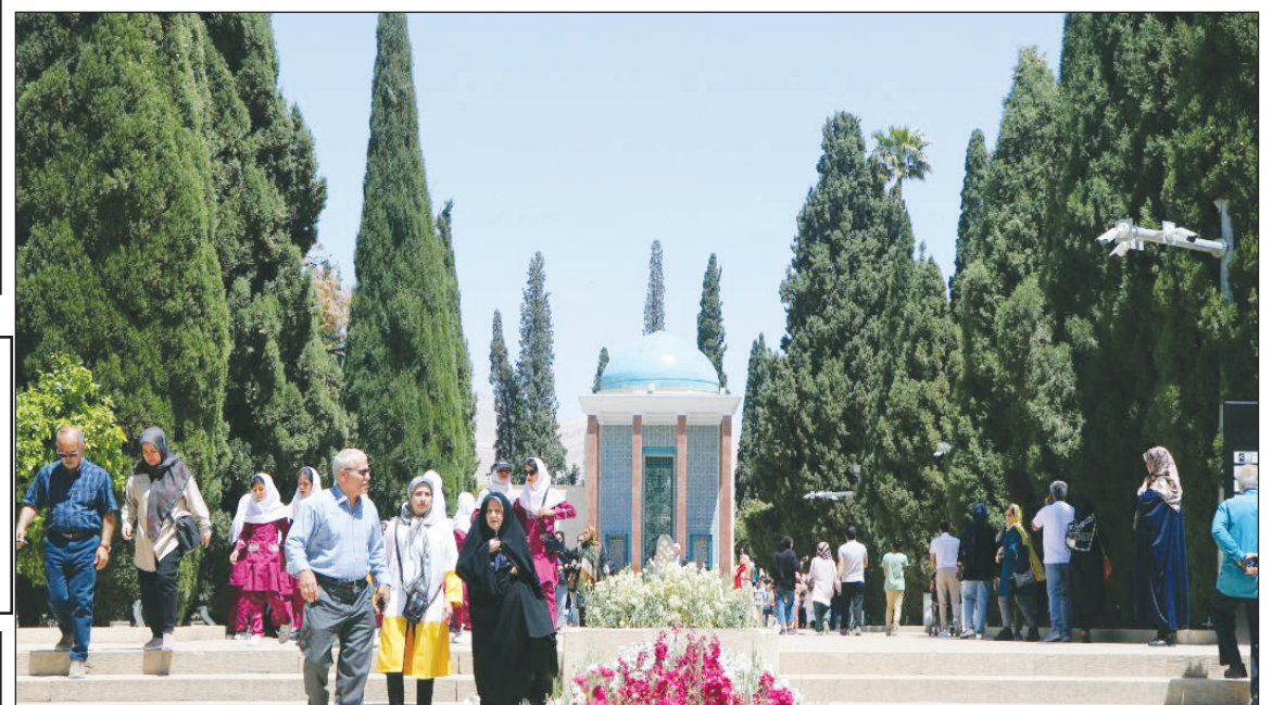
گزارش شهر مردم به مناسبت اول اردیبهشت ماه جلالی، روز بزرگداشت سعدی

کلنگ دو پروژه تقاطع غیر همسطح در ابتدا و انتهای بزرگراه شهید استوار با بیش از یک هزار میلیارد تومان به زمین زده شد