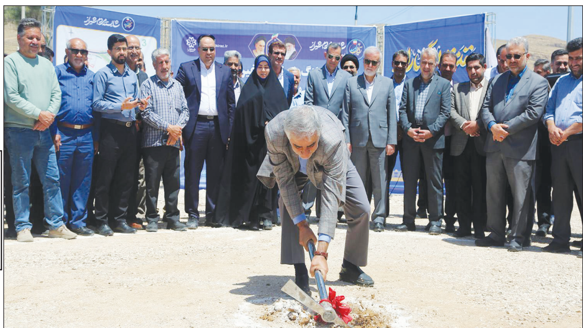
ادامه روایت امید از ابتدای سال؛

کلنگ دو پروژه تقاطع غیر همسطح در ابتدا و انتهای بزرگراه شهید استوار با بیش از یک هزار میلیارد تومان به زمین زده شد