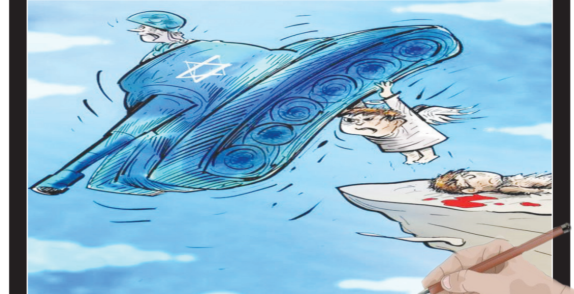
کاریکاتور پست: Türkiye _ Oğuz Gürel