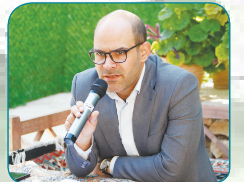
جلال الدین عرفانی- شهردار شیراز | هفته شیراز، در حالی که ۱۳ اردیبهشت ماه، آغاز می‌شود که معاونت فرهنگی، اجتماعی و ورزشی شهرداری شیراز، بیش از ۳۰ برنامه برای پاسداشت این هفته، در نظر گرفته است.

وی، افزود: یکی دیگر از فعالیت‌های ما، در حوزه گردشگری است که در کنار گردشگری در بافت تاریخی، ما توسعه گردشگری باغات قصدش را نیز مد نظر داریم و