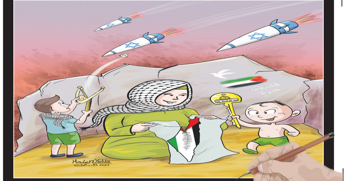
کاریکاتور است: هادر بهلا - مصر