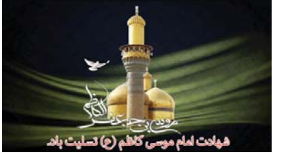
فهرست امام موسی کاظم (ع) تسلیت پاد

مدیر عامل شرکت آب منطقه ای فارس: تامین آب شرب شهرها و روستاهای استان اولویت کار آب منطقه ای فارس در تابستان آینده