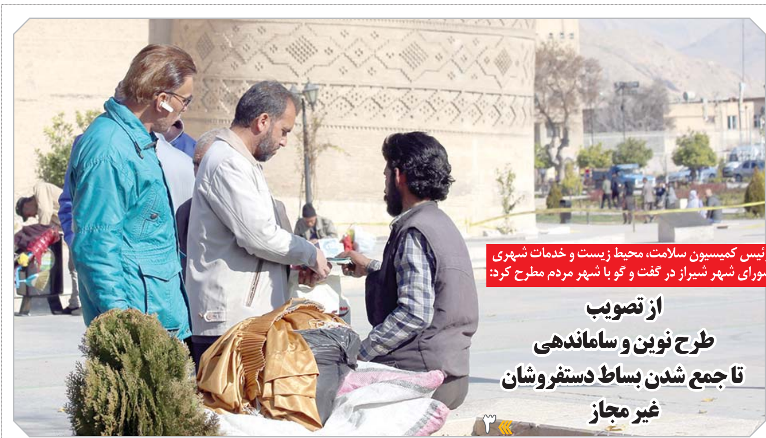
رئیس کمیسیون سلامت، محیط زیست و خدمات شهری شورای شهر شیراز در گفت و گو با شهر مردم مطرح کرد:

از تصویب طرح نوین و ساماندهی تا جمع شدن بساط دستفروشان غیر مجاز