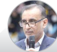
مدیرکل آموزش و پرورش فارس:

ایرنا - بازرس ویژه رئیس جمهور در غرفه ایرنا از برکناری بیش از ۹۰ مدیر متخلف و ترک فعل کرده خبر داد. حجت الاسلام والمسلمین حسن درویشیان بازرس ویژه رئیس جمهور پس از بازدید از غرفه ایرنا در نمایشگاه رسانه‌های ایران در گفت و گو با خبرنگار ایرنا از برکناری بیش از ۹۰ مدیر متخلف و ترک فعل کرده خبر داد. درویشیان در این گفت و گو افزود: شایسته‌گزینی یکی از اصول ۱۲ گانه پیشگیری