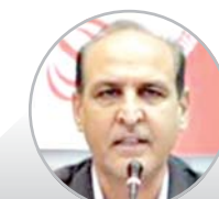
مدیر عامل آبفا فارس مطرح کرد:

بیش از ۳۸ هزار دانش آموز رأی اولی در فارس داریم