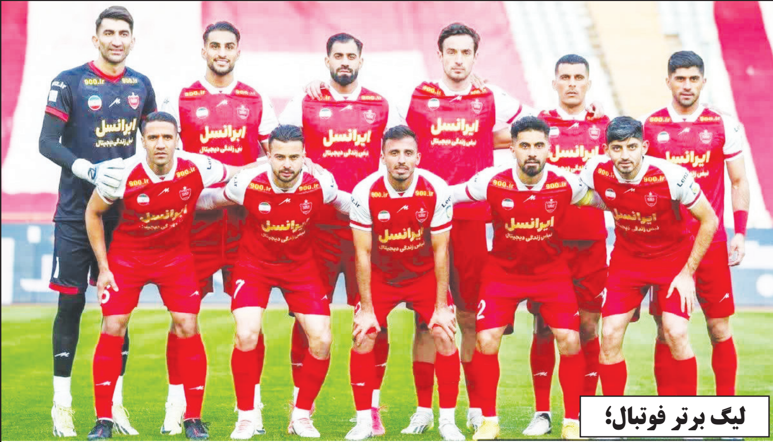
لیگ برتر فوتبال؛