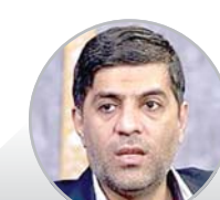
مدیر کل میراث فرهنگی فارس خبر داد:

تأمین ۱۰۳ هزار متر لوله به منظور آبرسانی به ۱۱۶ روستای فارس توسط یک بنیاد خیریه