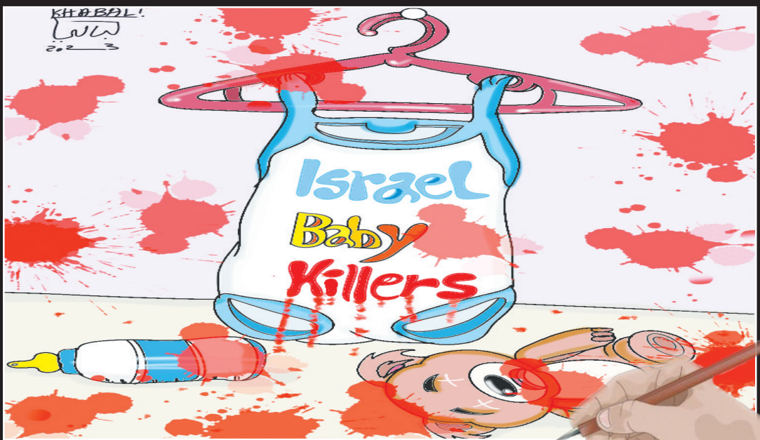
کاریکاتور پست: احمد خیالی عراق