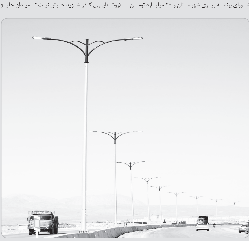
از معاون وزیر راه و شهرسازی و رئیس سازمان حمل و نقل جاده ای کشور برای ایجاد روشنایی مناطق پرخطر جاده های فسا به جهرم و فسا به داراب (روشنایی زیرگذر شهید خوش نیت تا میدان خلیج فارس (کمربندی شهر فسا)، روشنایی ورودی روستای میدان خلیج فارس تا روستای دشت احمد، روشنایی

ادامه مسیر میدان امام علی(ع) تا روستای دستجه • پیگیری و اخذ دستور وزیر جهت ایجاد شبکه و انتقال برق روستاهای زرسفید و چهل چشمه بهارستان ۱۴۰۰ با اعتبار ۳۰ میلیارد ریال جهت تأمین روشنایی معابر ۹ روستای شهرستان فسا: چاه دولت، سده، اکبرآباد، دیندارلو، شهرستان، دولت آباد، صحرارود، خیرآباد، دستجه • پیگیری اختصاص اعتبار در قالب طرح بهارستان ۱۴۰۱ با اعتبار ۶۵ میلیارد ریال جهت تأمین روشنایی معابر ۱۸ روستای شهرستان فسا: صحرارود، هارم، دشت احمد، کوشکقاضی، سده، فدشکویه، بیدزرد، امیرحاجیلو، زنگنه، خورنگان، موردی، صالح آباد، شورآباد، مهدی آباد، غیث آباد، دهشیب، خیرآباد، سنن • پیگیری اختصاص اعتبار در قالب طرح بهارستان ۱۴۰۲ با اعتبار ۱۲۰ میلیارد ریال جهت تأمین روشنایی معابر ۱۹ روستای شهرستان فسا: بیشه زرد، نصیرآباد، سنن، رحیم آباد، تنگ کرم، کچویه، خیرآباد میانجنگل، آب آسمانی، شستگان، مقابری، له قربانی، قاسم آباد سفلی، قاسم آباد علیا، داراکویه، قادرآباد، کبک آباد، جلیان، دولت آباد سه چاه، صادق آباد ■ حوزه های عمومی: • اعطای بیش از ۱۲۰۰ فقره تسهیلات به مردم و پیگیری دهها تسهیلات برای کارفرمایان و کارآفرینان و پیگیری استسهال تسهیلات فعالان بخش خصوصی • پیگیری ارتقاء بخش های شیبکوه و ششده و قره بلاغ و نوبندگان به شهرستان و پیگیری ارتقاء روستاهای فدشکویه، خورنگان، صحرارود، کوشک قاضی، زنگنه، امیرحاجیلو و دستجه به شهر (تشریفات اداری و کارشناسی این موضوع در وزارت کشور در حال انجام است) • پیگیری اجرای مسقف کردن بازار توسط شهرداری فسا در راستای مطالبات بازاریان و کسبه (طرح اولیه اجرای اسقف بازار توسط شهرداری فسا تهیه شده و با مناقسه اجرای پروژه و تعیین پیمانکار، عملیات اجرایی آغاز خواهد شد)