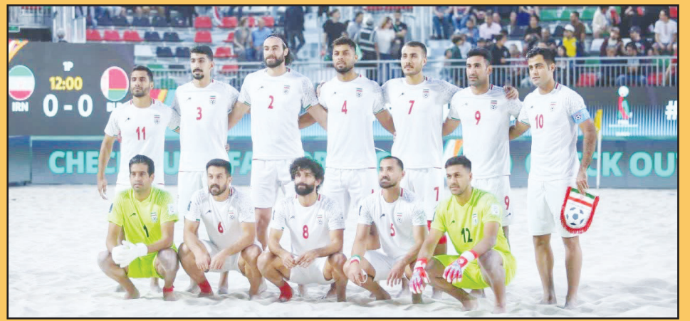
«ورزش سه» تیم ملی فوتبال ساحلی ایران پس از کسب ۷ امتیاز و صدرنشینی در دور گروهی جام جهانی ۲۰۲۴ به مرحله یک چهارم نهایی رسید و پس از آن هم امارات میزبان را از پیش رو برداشت تا شانس