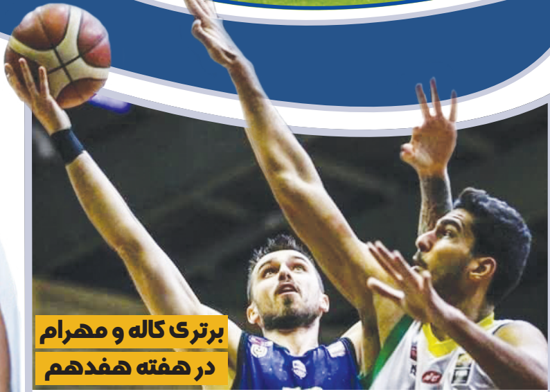
برتری کاله و مهرام در هفته هفدهم