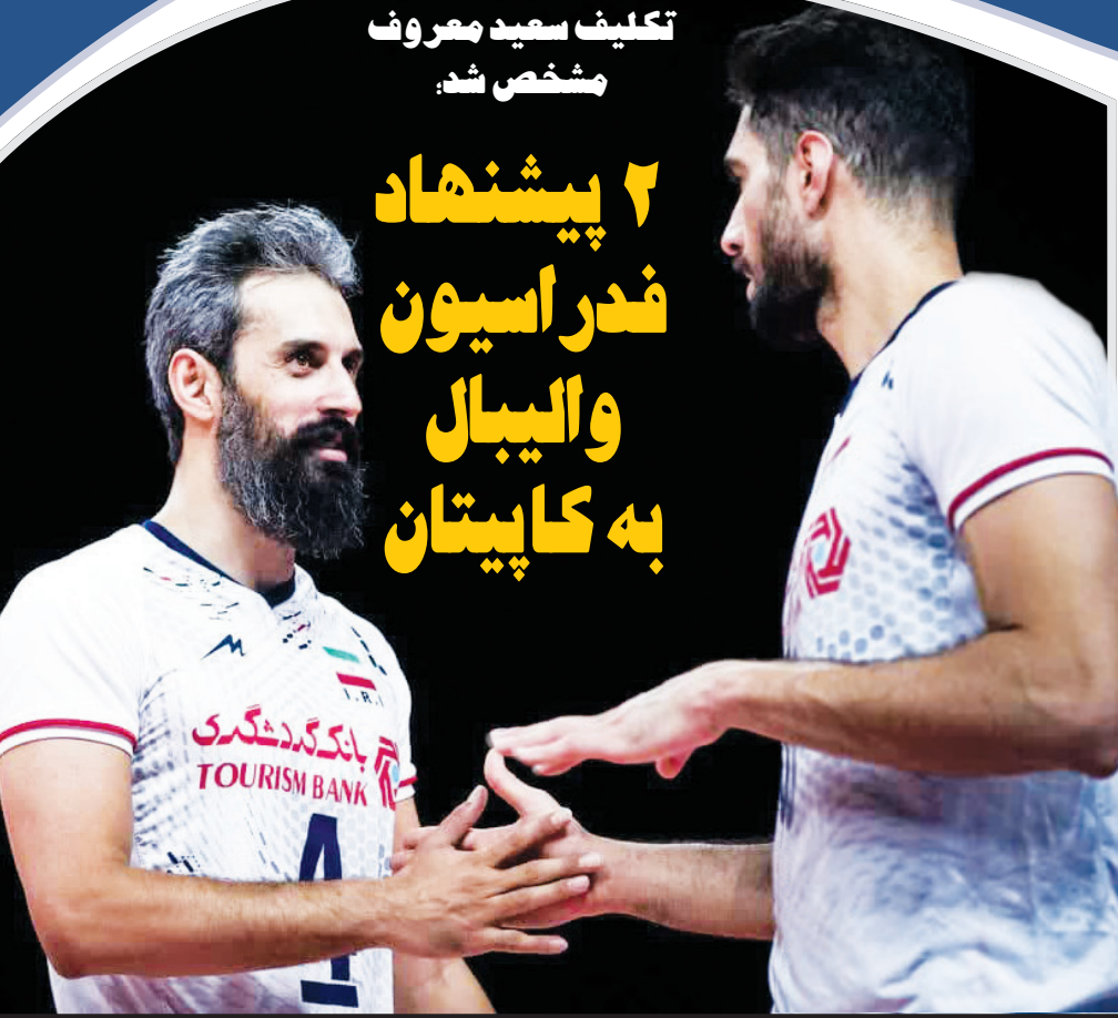
تکلیف سعید معروف مشخص شد:

تیم ملی فوتبال عراق با شکست ۳ بر ۲ برابر اردن از گردونه رقابت‌ها کنار رفت. پس از آنکه «ایمن حسین» گل دوم عراق را در دقیقه ۷۶ به ثمر رساند و این تیم را ۲ بر یک پیش انداخت علی‌رضا فغانی داور این دیدار به دلیل شادی گل این بازیکن، او را با کارت زرد دوم جریمه و از زمین اخراج کرد. پس از این اخراج، تیم ملی فوتبال اردن با دو گل پیاپی در دقیقه ۸۰ و ۸۵ موفق شد با نتیجه ۳ بر ۲ پیروز شود و به مرحله یک چهارم نهایی راه پیدا کرد. این اتفاقات موجب شد کاربران شبکه‌های اجتماعی در عراق و بسیاری از خبرنگاران ورزشی این کشور به علیرضا فغانی حمله کنند و او را مورد توهین و اتهام قرار دهند. ضمن اینکه در کنفرانس خبری پس از این دیدار هم بین «خسوس کاساس» سرمربی تیم عراق و خبرنگاران عراقی چالش و جنجال به وجود آمد. کنفدراسیون فوتبال آسیا پس از این اتفاق از رفتار خبرنگاران حاضر در این نشست انتقاد و اعلام کرد افرادی که نظم مسابقات را به هم بریزند در حضور در ادامه مسابقات منع خواهد کرد. AFC نوشت: هر کس بخواهد استانداردها و موازین اخلاقی را زیر پا بگذارد با عواقب کارش مواجه خواهد شد. AFC همچنین بر حمایت از مسوولین برگزاری مسابقات تأکید کرد و گفت: هر کس بخواهد با رفتار مخرب خود امنیت مسوولان برگزاری مسابقات را به خطر بیندازد و شهرت بازی‌های ما را خدشه دار کند با واکنش ما مواجه خواهد شد.