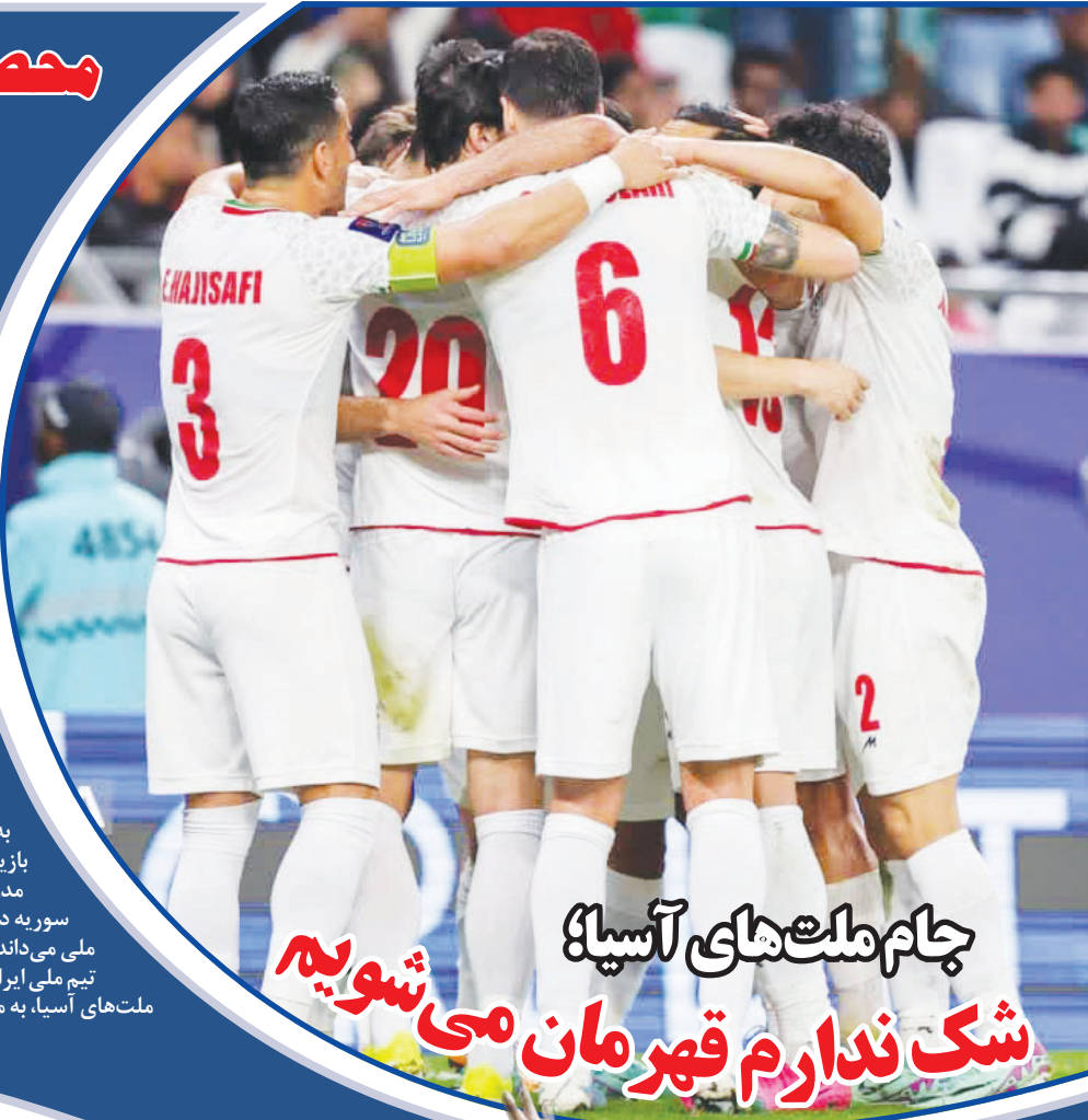
جام ملت‌های آسیا شک ندارم قهرمان می‌شویم

تیم ملی ایران چهارشنبه ساعت ۱۹:۳۰ دقیقه در ورزشگاه عبدالله بن خلیفه در مرحله یک‌هشتم هجدهمین دوره جام ملت‌های آسیا، به مصاف سوریه خواهد رفت.