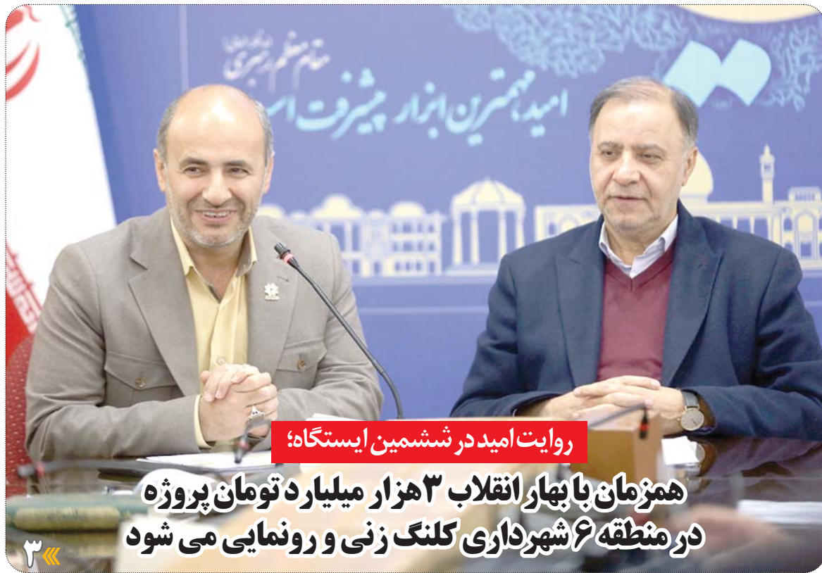
روایت امید در ششمین ایستگاه:

همزمان با بهار انقلاب ۳ هزار میلیارد تومان پروژه در منطقه ۶ شهرداری کلنگ زنی و رونمایی می شود