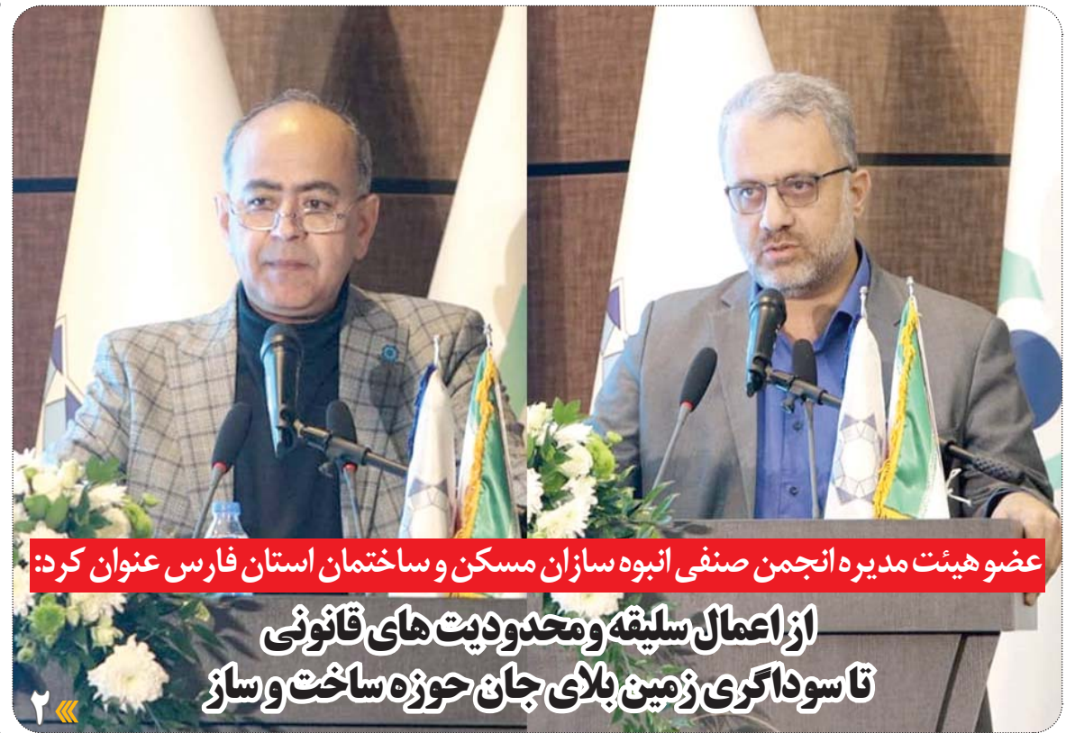
عضو هیئت مدیره انجمن صنفی انبوه‌سازان مسکن و ساختمان استان فارس عنوان کرد:

همزمان با بهار انقلاب ۳ هزار میلیارد تومان پروژه در منطقه ۶ شهرداری کلنگ زنی و رونمایی می شود