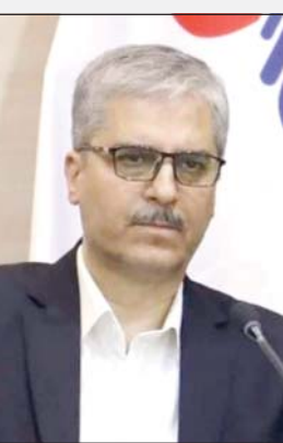
تولیدات متنوع انواع محصولات پتروشیمیایی نقش مهمی در اقتصاد کشور دارد.