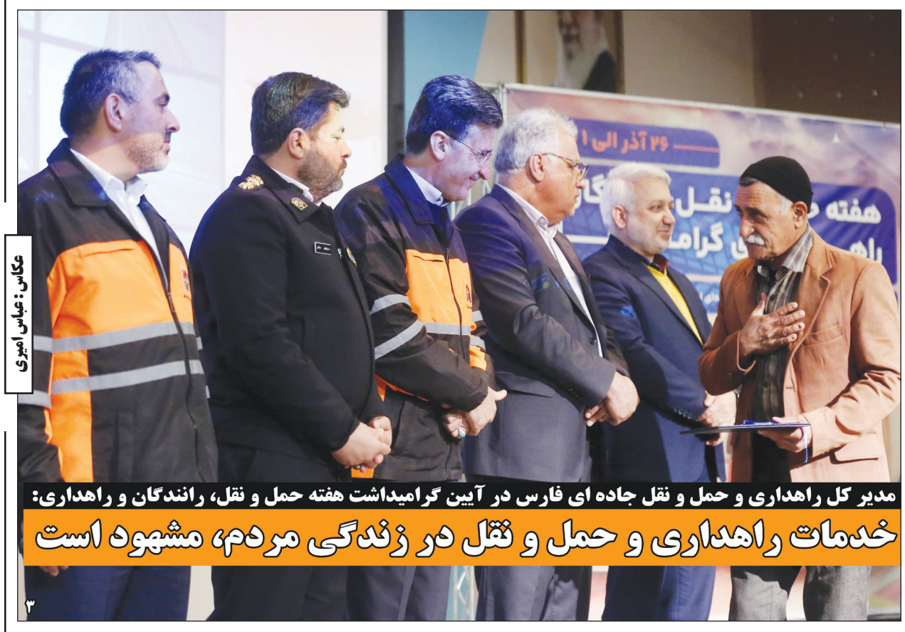
مدیر کل راهداری و حمل و نقل جاده ای فارس در آیین گرامیداشت هفته حمل و نقل، رانندگان و راهداری: خدمات راهداری و حمل و نقل در زندگی مردم، مشهود است