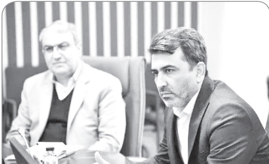
وی تصریح کرد: ضروری است تفکر هزین‌یستی مسالمت‌آمیز در زندگی و کسب‌وکار را توسعه دهیم و میدان بازی را در صنعت نمایشگاهی تغییر دهیم، با تعریف