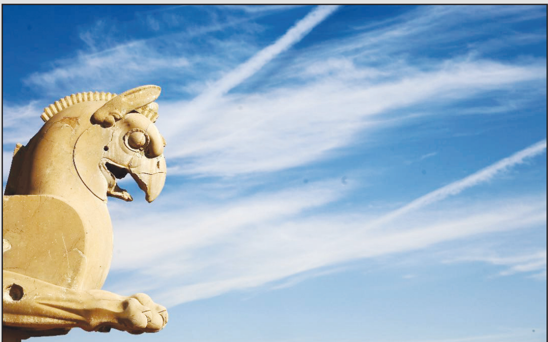
جلای زیبای آسمان به تصویر آثار باستانی پارسه