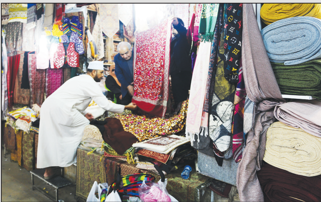
بازار گردی گردشگران خارجی در بازار وکیل شیراز