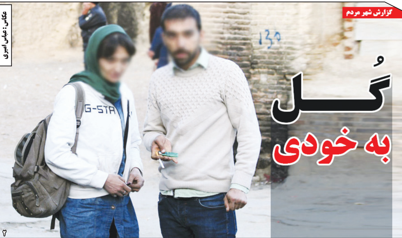
گزارش شهر مردم