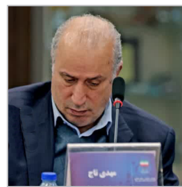
ایرنا | مهدی تاج رئیس فدراسیون فوتبال در حاشیه مراسم معارفه مجید جلالی، مدیر توسعه و پیشرفت فوتبال کشورمان تکنیکال دایرکتور، در جمع خبرنگاران اظهار داشت: یک جاهایی در فدراسیون فوتبال حلقه‌های گمشده وجود دارد و باید بتوانیم

تیم‌های نوجوانان، جوانان و امید را به گونه‌ای بار... بیاوریم تا در تیم ملی بزرگسالان از آنها جواب بگیریم. شهرداری‌ها، وزارت ورزش، دانشگاه‌ها، آموزش و پرورش‌ها کار می‌کنند، ولی حلقه اتصال بین آنها وجود نداشت. این همان چیزی بود که به آن تکنیکال دایرکتوری می‌گویند. افزودن این کار به صورت جدی شروع شده است. آرسن ونگر، ۲ یا سه سال پیش در قطر در جلسه به من گفت باید این واحد را راه اندازی کنید. خوشبختانه امروز انجام شد، جلالی خودش علاقه‌مند است و اطلاعات کافی دارد و صاحب نظر است. ژاپن نقطه استاندارد فوتبال آسیاست و اگر فدراسیون فوتبال ایران بخواهد فوتبالی ژاپن را ببرد از نظر این چیزها از این کشور عقب است. از ما انتظار حرفه‌ای علمی و مبتنی بر شرایط و اطلاعات می‌رود. شاید ژاپن ببرد یا بیزاد، ولی حرفی که من زدم ارتباطی به برد و باخت‌هایش ندارد. ژاپن مدتی است که هر آنچه را که گفته‌اند، عملیاتی کرده است. رئیس فدراسیون فوتبال ادامه داد: برخی از کشورها در آسیا شروع کرده‌اند و برخی کشورها نیز که فکر