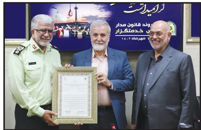
شهردار شیراز در آیین تجلیل از فرماندهی انتظامی و مدافعان نظم و امنیت فارس: