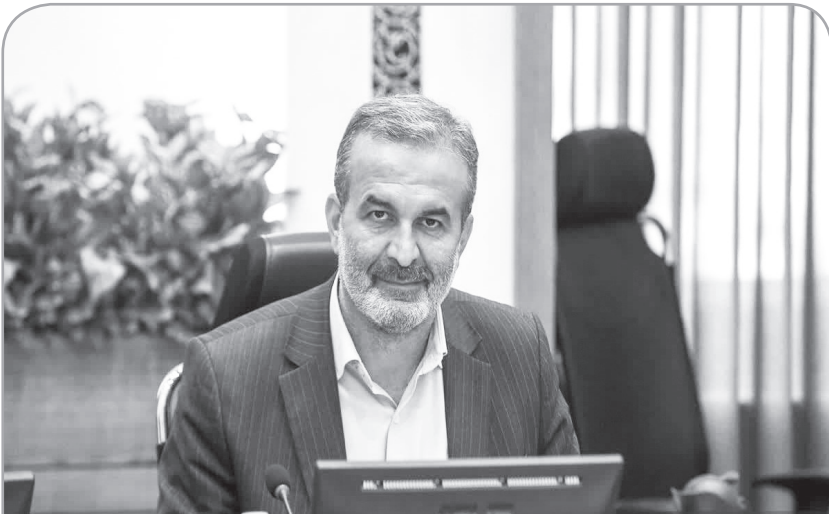
جانبازان عرصه امنیت کشور در مقابل متعرضین به جان و مال و امنیت مردم را گرمای می‌داریم و برای خدمت گزاران

این عرصه آرزوی سلامتی داریم. وی با گرمی‌بخشیدن روز جهانی کودک بیان کرد: سربلندی و توفیق کودکان آرزوی ماست. این روز فرصتی است که به موضوع کودکان، نیازها و خواسته‌های این نسل توجه کنیم و زمینهای برای همگرایی فعالیت دستگاه‌ها و نهادهای متولی کودکان و ارتقا سطح دانش و آگاهی فعالان حوزه کودک است. سامع خاطر نشان کرد: این روزها شاهد برگزاری سی و پنجمین جشنواره فیلم‌های کودکان و نوجوانان در شهر اصفهان هستیم که پس از چهار سال برگزار می‌شود. بیش از ۴۰ کشور در این جشنواره آثار خود را ارائه کرده‌اند و اتفاق خوب این دوره حضور پررنگ کودکان و نوجوانان به عنوان داور و خبرنگار است. این مقام مسئول بیان کرد: رویدادهای شهری در نقاط مختلف شهر و محلات در جریان این جشنواره در حال برگزاری است، جشن‌هایی برپاست و دانش آموزان نیز در برنامه‌ها حضور دارند که قابل تقدیر است.