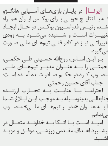
رحمتی مدیر تیم های ملی بوکس شد