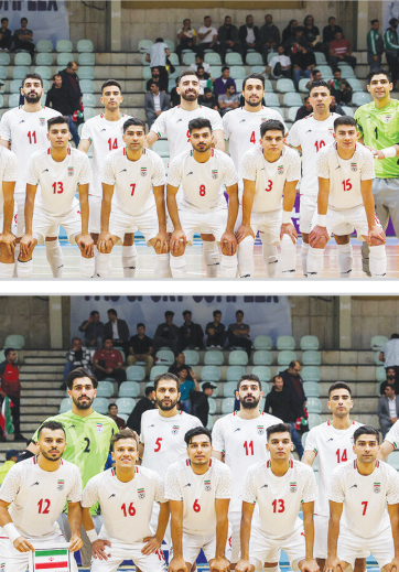
تیم ملی فوتبال ایران در دیدار بعدی خود مقابل لبنان قرار خواهد گرفت.

تیم ملی فوتبال ایران در مرحله مقدماتی جام ملت های آسیا ۲۰۲۴ در گروه C مسابقات با تیم های قزیزستان، مالدیو و لبنان همگروه است. تیم ملی فوتبال کشورمان در دیدار بعدی خود مقابل لبنان قرار خواهد گرفت.