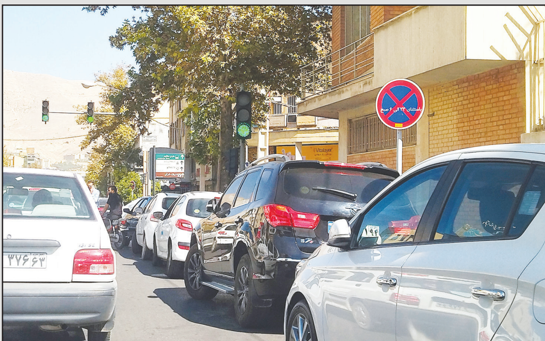
بی‌اعتنایی برخی از رانندگان به قوانین و لزوم برخورد قاطع و بازدارنده پلیس در خیابان‌های شیراز