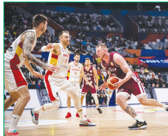
ایستنا | در جریان نخستین روز از بازی‌های مرحله دوم جام جهانی بسکتبال ۲۰۲۳ (گروه برنده‌ها)، تیم ملی اسپانیا در دیداری عجیب با نتیجه

نتایج بازی‌های امروز نیز تا به این لحظه به شرح زیر رقم خورده است: صربستان ۷۶ - ۷۸ ایتالیا آلمان ۱۰۰ - ۷۳ گرجستان آمریکا ۸۵ - ۷۳ مونته‌نگرو اسپانیا ۶۹ - ۷۴ لتونی جمهوری دومینیک - پورتوریکو اسلوانی - استرالیا لیتوانی - یونان کانادا - برزیل.