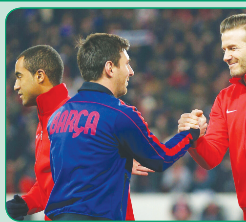
به «مال‌ال» را به یکی از دو یا سه لیگ مطرح جهان بدل کند

ایرنا | لیونل مسی، فوق ستاره سابق باشگاه پاری‌سن‌ژرمن و تیم ملی آرژانتین که همواره سوزده محافل فوتبالی بوده، با خبر رد پیشنهاد هنگفت باشگاه الهلال عربستان و امضای قرارداد با این تیم، یازدهم به تیر یک رسانه‌های ورزشی بدل شد.