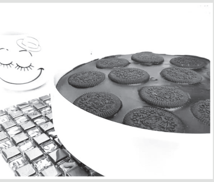
دسر اورپو یکی از انواع دسرهای خوشمزه بین المللی است که با بیسکویت اورپو تهیه می شود.

برای تهیه دسر اورپو ابتدا یک ظرف مناسب انتخاب می کنیم، سپس دو سوم شیر را داخل یک کاسه می ریزیم و جلوی دستمان قرار می دهیم. در ادامه یک لایه بیسکویت اورپو را ابتدا در شیر می زنییم، سپس در کف ظرف می چینیم. ■ مرحله دوم در این مرحله ۲۰۰ گرم از خامه را به همراه پنیر خامه ای، پودر خامه یا خامه فرم گرفته، یک سوم لیوان شیر و شیر عسلی داخل یک کاسه مناسب می ریزیم، سپس به خوبی ترکیب می کنیم. ■ مرحله سوم پس از اینکه مواد کاملا یکدست شدند، آنها