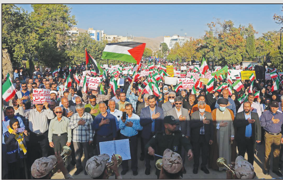
تجمع مردم شیراز در محکومیت جنایات رژیم صهیونیستی در غزه