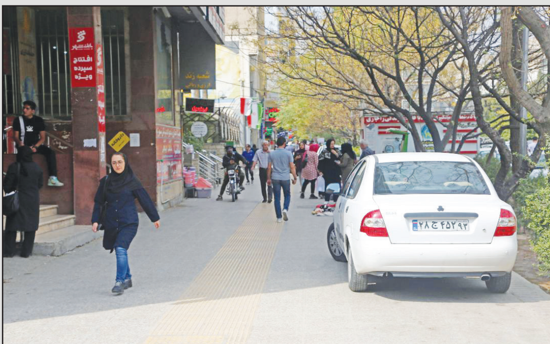
چند ناهنجاری در یک قاب: از پارک اتومبیل و حرکت موتور تا دستفروش ها در پیاده رو بلوار زند شیراز