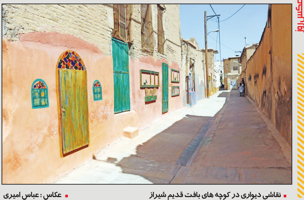
نقاشی دیواری در کوچه‌های بافت قدیم شیراز