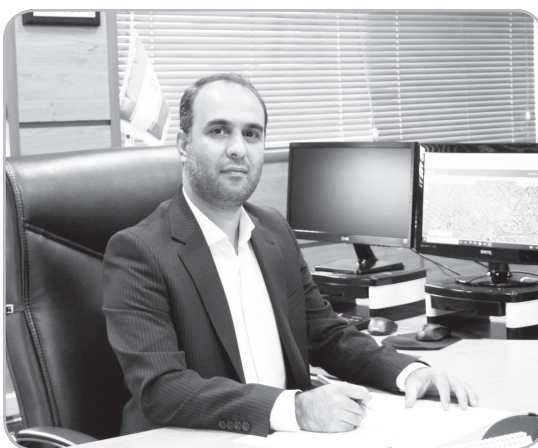
استدزاده گفت: در باغ جنت در راستای ایجاد زیرساخت ها بهسازی واحداث آبنمای موزیکال با اعتبار بیش از ۴۰ میلیارد ریال و راه اندازی و به روز رسانی

تاسیسات آبنماها و احداث یک زمین بازی کودکان در محل جنب نمازخانه پارک در حال بررسی و اجرا در سال جاری است. وی گفت: اجرای مسیر دوچرخه سواری دور پارک باغ جنت ساخت اتناق مدیریت زمین ورزشی فوتبال ساحلی به همراه رختکن وسرویس بهداشتی در محل زمین فوتبال ساحلی و تکمیل دیوارگذاری دور باغ جنت و شروع کف فرش بیرونی باغ جنت در سال جاری اجرا خواهد شد. همچنین خط کشی زمین های ورزشی و رنگ آمیزی نرده های ورودی پارکینگ با مبلغ کلی پروژه بالغ بر ۳ میلیارد ریال از طرح هایی است که شهرداری منطقه چهار در حال اجرا می باشد.