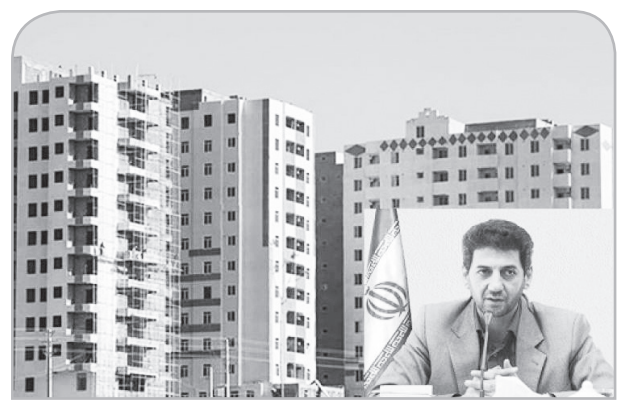
زلزله رخ داد، خراب نشود.

در مجموع ۴۴۰ هزار نفر در طرح نهضت ملی مسکن استان ثبت نام کردند که از این تعداد ۱۴۸ هزار نفر حائز شرایط و ۱۲۰ هزار نفر تأیید نهایی شدند و برای تکمیل مدارک، افتتاح حساب، تأمین زمین و آغاز پروژه اقدام کردند. قاری قرآن با بیان اینکه ۶۵ هزار متقاضی نهضت ملی مسکن استان در شهرهای جدید همچون فولادشهر و مجلسی و ۸۳ هزار نفر در شهرهای دارای جمعیت بالای یکصد هزار نفر هستند، اضافه کرد: از جمع ۸۳ هزار متقاضی ۳۵ هزار نفر در شهرهای با جمعیت بالای یکصد هزار نفر شامل اصفهان، کاشان، نجف‌آباد و ۴۷ هزار نفر در ۹۰ شهر واجد جمعیت کمتر از یکصد هزار نفر ساکن هستند که به همین روال نیز در بخش تأمین زمین و نوع آن اقدام می‌شود. اصفهان را توسط مشاور وزارت راه و شهرسازی دنبال کرد و مرکز تحقیقات ایسن وزارتخانه طبق قرارداد مطالعات پهنه شهر اصفهان و دشت اصفهان - برخوردار، شرق و جنوب شرق آن و پایین دست رودخانه را انجام داده و راهکارهای کنترل فرونشست مشخص شده است. وی با بیان اینکه ۱۴۸ هکتار اراضی شاهین‌شهر در معرض پدیده فرونشست است، افزود: یکی از الزامات و مصوبات شورای عالی شهرسازی و معماری در خصوص پروژه مسکن شاهین‌شهر این بود که اینجا نیازمند ملاحظات فنی است که شامل نحوه ساخت و پی‌ریزی بناها است. مدیر کل راه و شهرسازی استان اصفهان، اضافه کرد: در کشوری زندگی می‌کنیم که گسل‌های زیادی دارد، نمی‌توانیم بگوییم چون گسل وجود دارد ساخت‌وساز را باید تعطیل کنیم، اما در مقابل این پدیده فنی باید عملکرد و طراحی ساختمان‌ها به‌گونه‌ای باشد که اگر