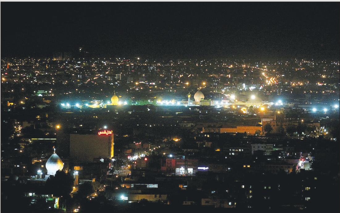
حرم مطهر حضرت شاهچراغ (ع): نگین درخشان شهر شیراز