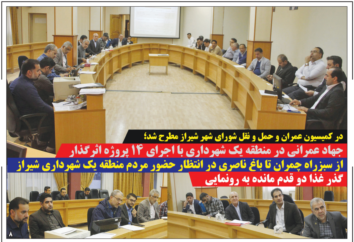
در کمیسیون عمران و حمل و نقل شورای شهر شیراز مطرح شد؛ جهاد عمرانی در منطقه یک شهرداری با اجرای ۱۴ پروژه اثرگذار از سبزه راه چمران تا باغ ناصری در انتظار حضور مردم منطقه یک شهرداری شیراز گذر غذا دو قدم مانده به رونمایی