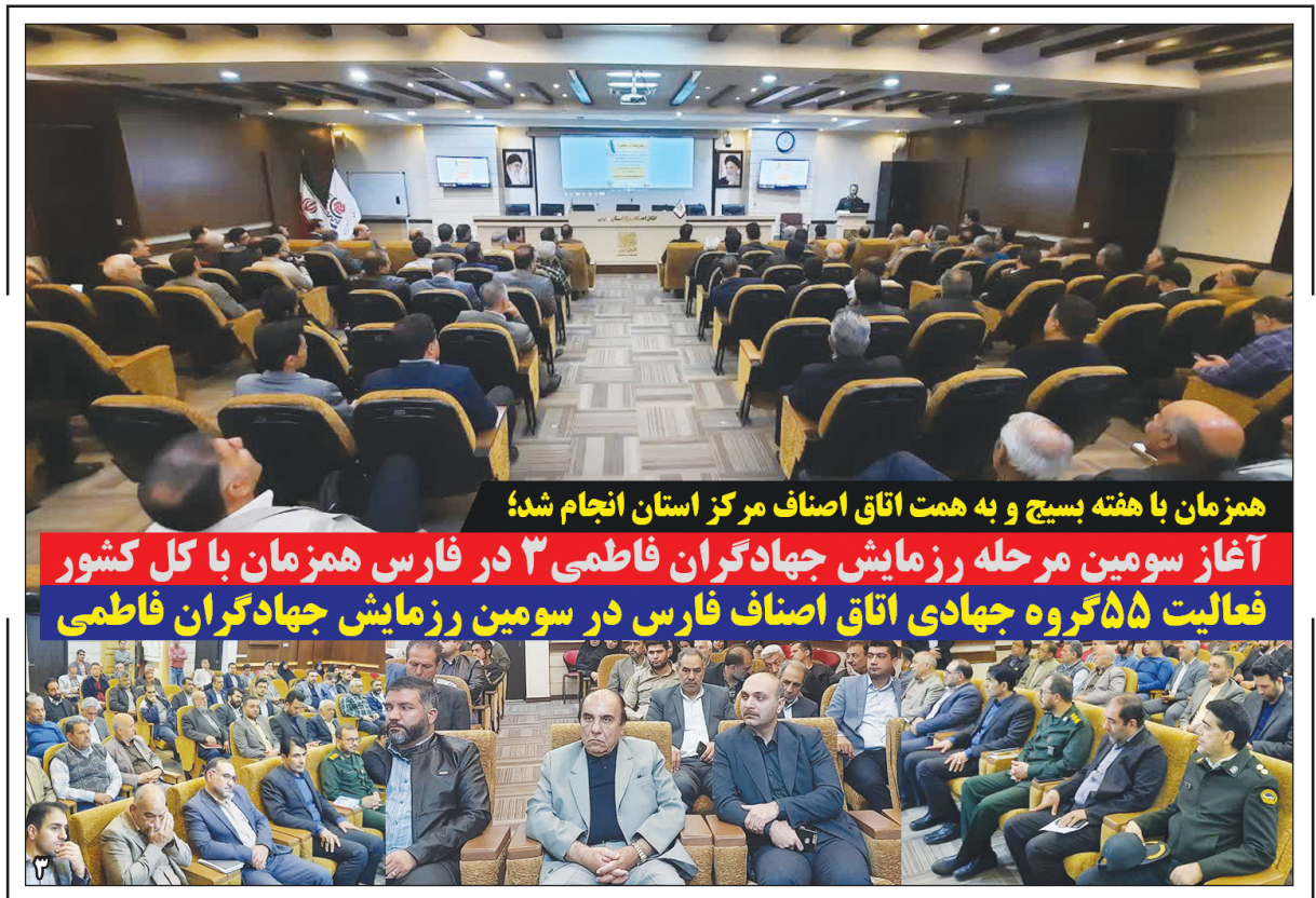
همزمان با هفته بسیج و به همت اتاق اصناف مرکز استان انجام شد؛ آغاز سومین مرحله رزمایش جهادگران فاطمی ۳ در فارس همزمان با کل کشور فعالیت ۵۵ گروه جهادی اتاق اصناف فارس در سومین رزمایش جهادگران فاطمی