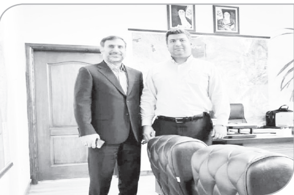
سرویس شهرستانها - لارستان - شهر مردم | پیگیری