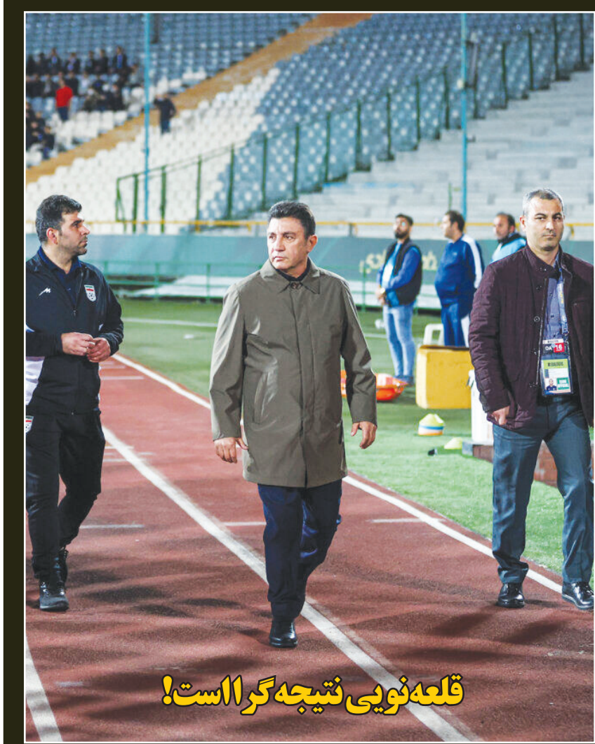
قلعه نویی نتیجه گرا است!