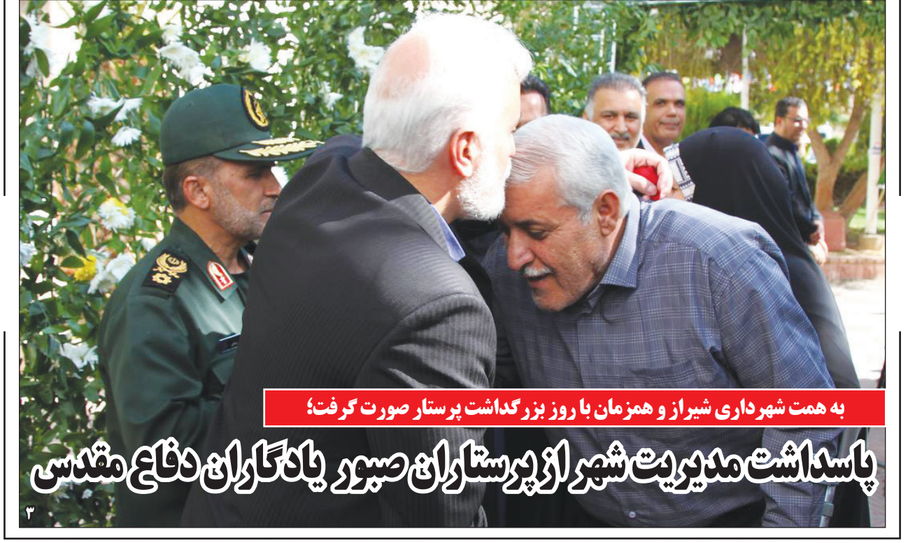
به همت شهرداری شیراز و همزمان با روز بزرگداشت پرستار صورت گرفت؛ پاسداشت مدیریت شهر از پرستاران صبور یادگاران دفاع مقدس