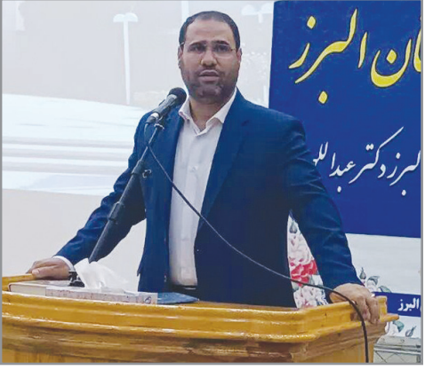
وزیر آموزش و پرورش خبر داد:

عضو کمیسیون عمران مجلس: قدرت تسهیلات‌دهی بانک‌هایی که سهمیه ابلاغی بخش مسکن را نپزداند محدود می‌شود رئیس اتاق بازرگانی، صنایع، معادن و کشاورزی فارس: پیشنهاد رئیس اتاق بازرگانی فارس پیرامون معافیت پیمان سپاری بخش کشاورزی