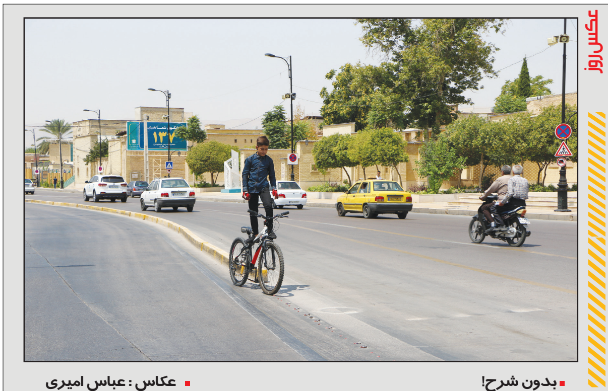
بدون شرح!