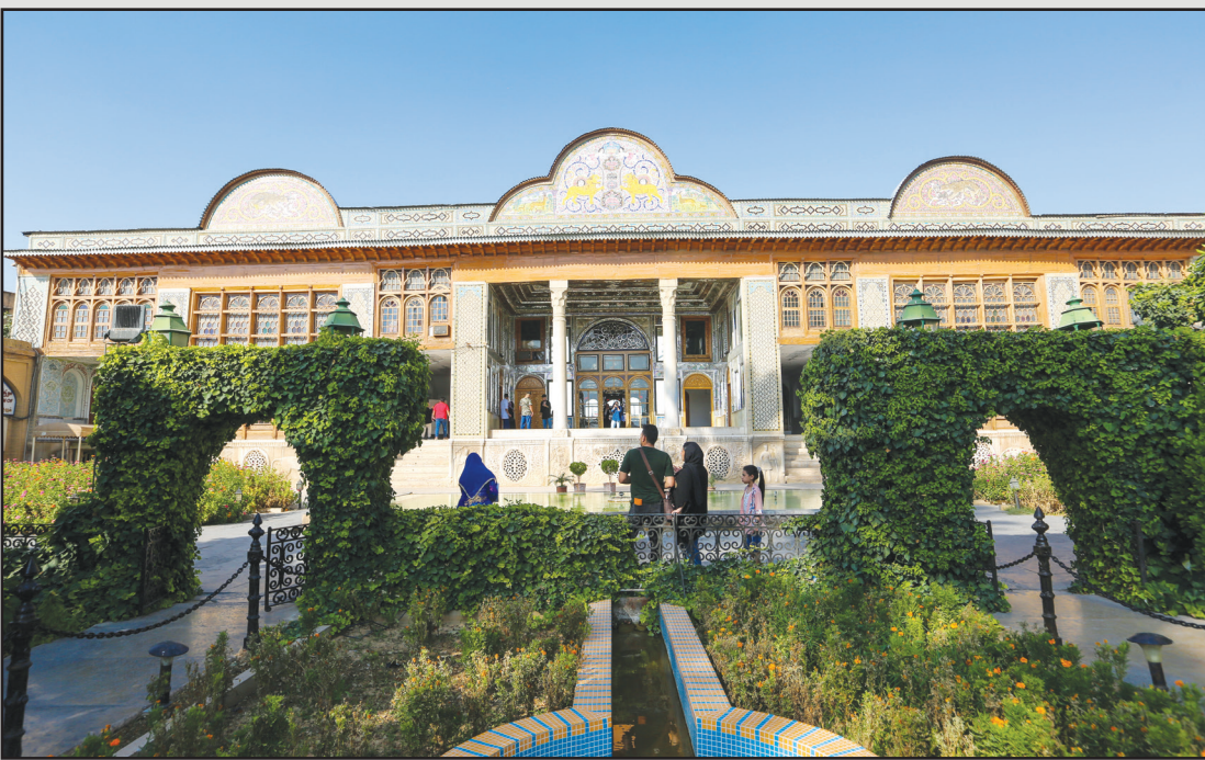
باغ ارم شیراز