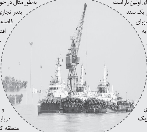
دریا در سیاست های کلی توسعه دریامحور یک فرصت بالقوه است