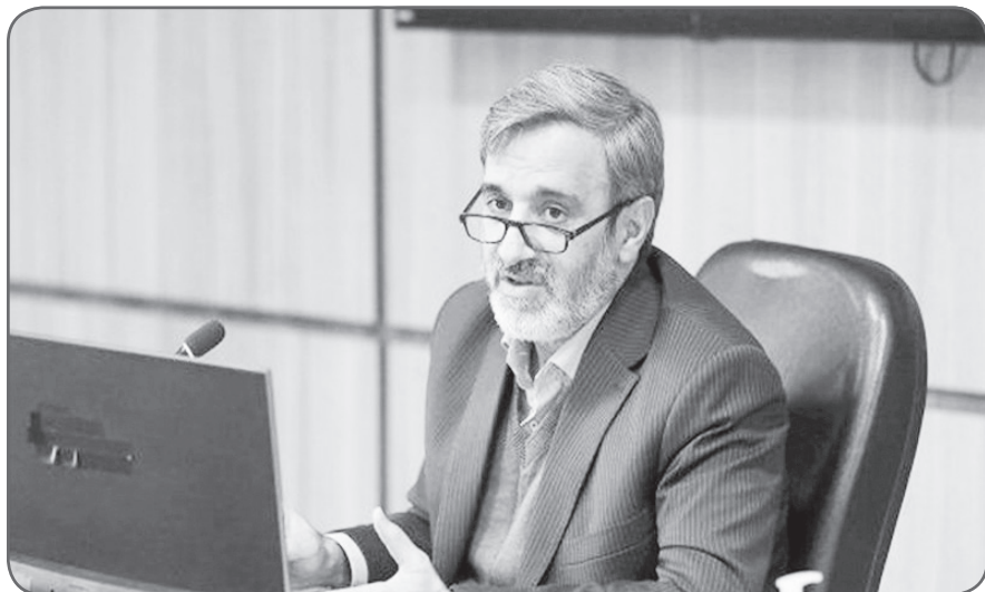
آئینی افزود: در طرح کلید به کلید در بافت های فرسوده شرکت مادر تخصصی عمران شهرهای جدید و شرکت بازآفرینی شهری ایران همیاری و همکاری کامل دارند و شهری (طرح کلید به زمین) سازمان ملی زمین و مسکن،

تسلیم | مدیرعامل شرکت بازآفرینی شهری ایران از تصویب آیین نامه اجرایی طرح کلید به کلید در دولت و ابلاغ دستورالعمل آن خبر داد.