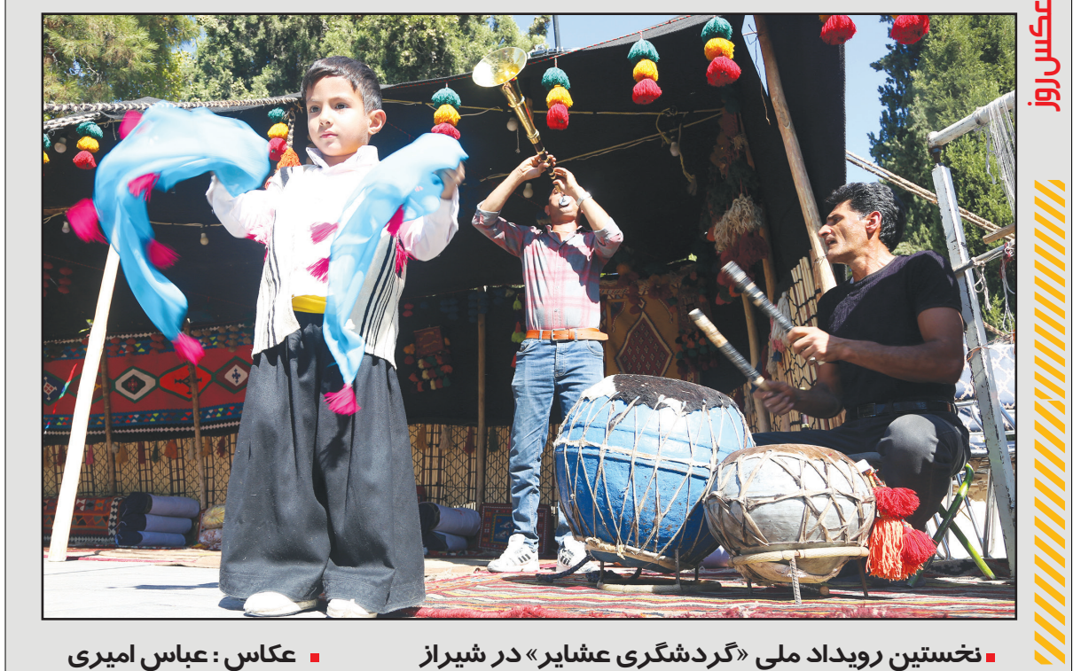
نخستین رویداد ملی «گردشگری عشایر» در شیراز

ایرنا | حسین عبدی پس از شکست ۲ بر یک شاکردانش مقابل انگلیس در دور دوم مرحله گروهی این در حالی بود که پس از نمایش ضعیف این مدافع در دو فصل اخیر، در این فصل بازوبند کاپیتانی از او گرفته شد و حتی صحبت از انتقالش به وستهم در نقل‌وانتقالات تابستانی به گوش می‌رسید. این حال مگوایر پس از نیمکت نشینی در دو بازی اخیر به ترکیب تیم بازگشته و با نمایش قابل قبولش توانسته دوباره نظر سرمربی هلندی را به خودش جلب کند تا جایی که تن‌هاخ پس از پایان بازی دیشب به تمجید از مدافع کهنه‌کار تیم ملی انگلیس پرداخت. تن‌هاخ پس از بازی با شیفلد گفت: مگوایر آنطور که ما می‌خواهیم بازی می‌کند و از عملکردش خوشحالم. سرمربی هلندی افزود: او در این دو بازی مسلط بر حریف بود، در مواقع ضروری به خوبی وارد جریان بازی می‌شد، بازی‌خوانی و پوشش خوبی داشت و در قدرت پا به توپ و مالکیت آن به خوبی عمل کرد و پاس‌های خوبی را ارسال کرد و در تغییر جریان بازی هم موفق بود. در مجموع او نمایش خوبی داشت. به مردم ایران تقدیم کنیم.