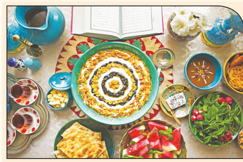
ادب افطار در پایان هر روز انجام می‌شود و در جوامع مسلمان سعادت و شادی را پس از روزی سخت به ارمان می‌آورد.