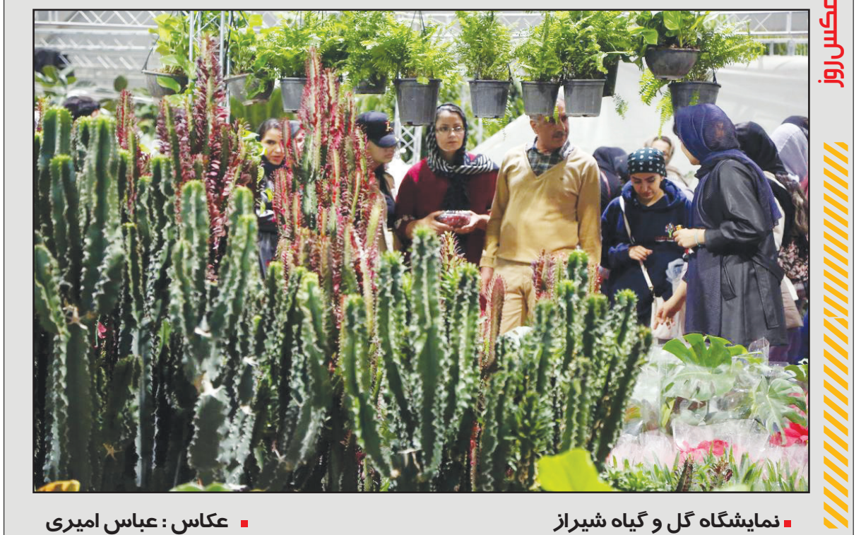
نمایشگاه گل و گیاه شیراز

نسنیم اتحادیه جهانی کشتی اسامی ۵ نامزد کسب عنوان «بهترین آزادکار جهان» در سال ۲۰۲۳ را منتشر کرد. در میان این پنج نامزد، نام امیر حسین زارع ملی پوش کشورمان نیز به چشم می خورد که به مقام قهرمانی جهان رسید. دیوید نیلور از آمریکا، اسماعیل موسوکائف از مجارستان، زانوریک سیداکوف از روسیه و احمد تاج الدینوف از بحرین، چهار کاندیدای دیگر تصاحب این عنوان ارزشمند هستند.