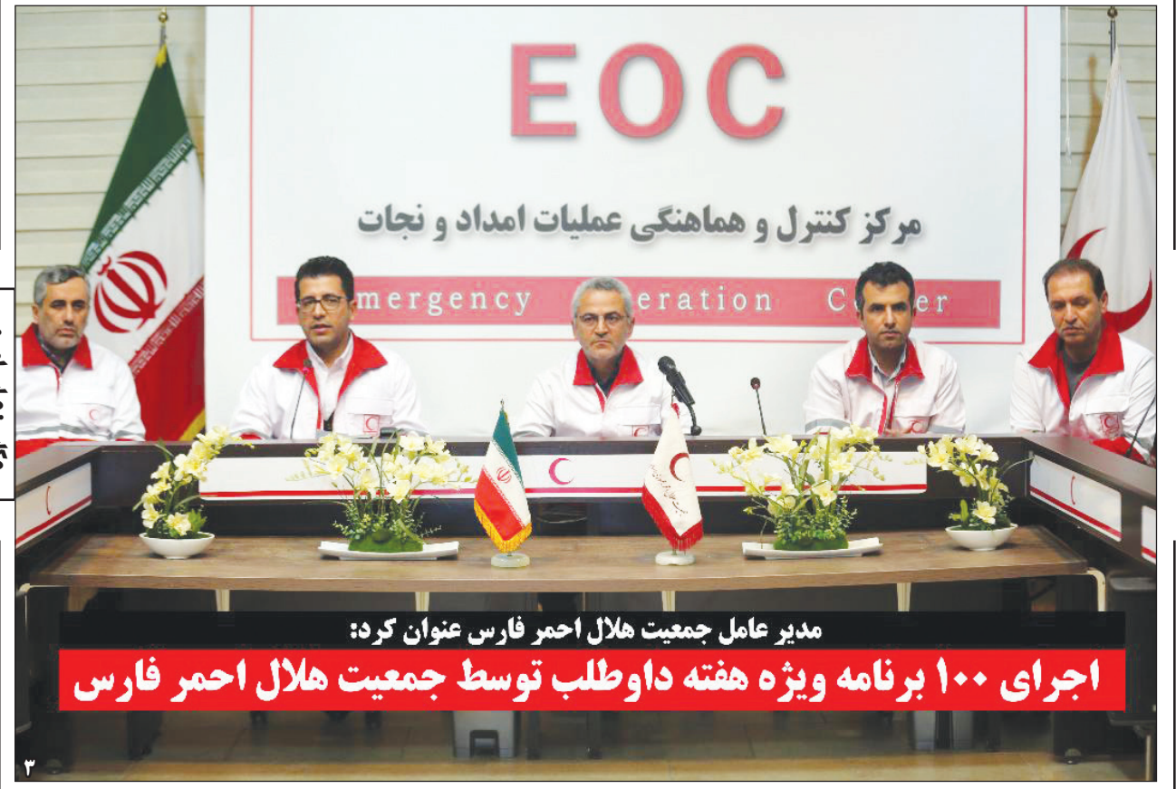
مدیر عامل جمعیت هلال احمر فارس عنوان کرد: اجرای ۱۰۰ برنامه ویژه هفته داوطلب توسط جمعیت هلال احمر فارس

وزیر آموزش و پرورش: در ارائه آموزش باکیفیت تنها مانده‌ایم