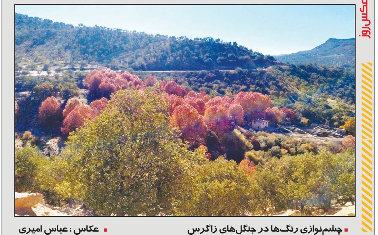
چشم‌نوازی رنگ‌ها در جنگل‌های زاگرس

ایرنا | گرچه پورتو در فصل گذشته در رقابت با بنفیکا نتوانست قهرمان لیگ برتر پرتغال شود اما مهدی طارمی مهاجم ایرانی «دراگون‌ها» با ثبت ۲۲ گل بالاتر از گونچالو راموس، مهاجم بنفیکا که ۱۹ گل زده بود، موفق شد به عنوان آقای گلی لیگ پرتغال دست پیدا کند و صاحب کفش طلا شود. درخشش طارمی در لیگ برتر پرتغال سبب شد تا تیم‌های بزرگ اروپایی درصدد جذب مهاجم تیم ملی ایران برآیند. آ.ت میلان و تاتنهام از جمله باشگاه‌های مهمی بودند که در تابستان سال جاری به دنبال جذب طارمی بودند. مهاجم تیم ملی ایران در این بین، پیشنهاد افواکننده الهلال عربستان را رد کرد تا به فوتبال خود در اروپا ادامه دهد. پیش از این، تقریباً تمام رسانه‌های مطرح