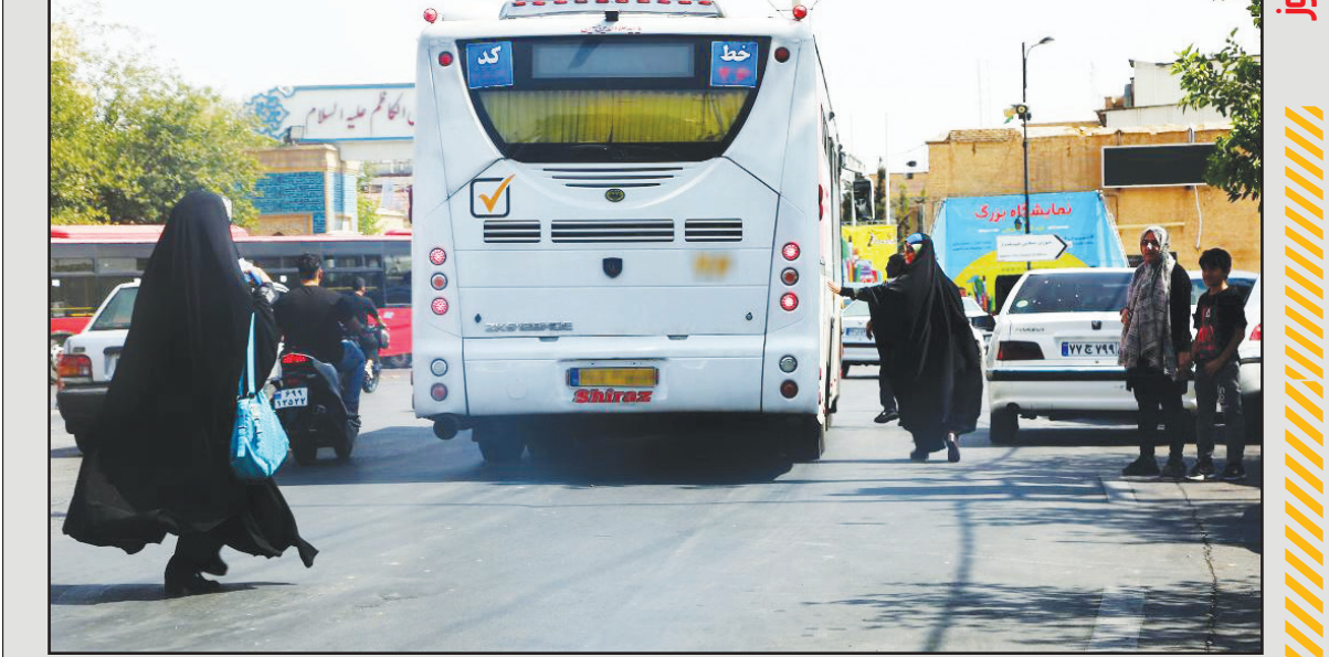
خارج از ایستگاه!