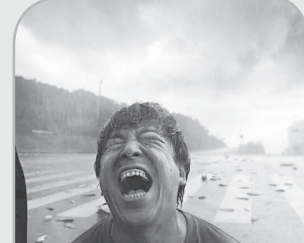
این ماجرا شد که با وجود کنجکاو فراوان و سر و صدای خوب در مورد کیفیت آن هرگز در چین اکران نشد.

فیلم جدید با اقتباس از یک رمان چینی به همین نام، درباره کشف راز یک قتل است و بر پدری (هوانگ بو) تمرکز دارد که وقتی دخترش در حین تحصیل در خارج از کشور در زاینه سه قتل می رسد، عهد انتقام می بندد. این فیلم با امتیاز بالا در شبکه های اجتماعی با پیش بینی فروش بالای ۸۰ میلیون دلار، به اکران ادامه می دهد.