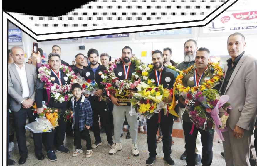
مردم قدرشناس استان فارس، روز گذشته با حضور در فرودگاه شهید دستغیب شیراز از ورزشکاران فارسی تیم ملی پرورش اندام و فیتنس ایران که در هفتاد و هفتمین دوره مسابقات پرورش اندام قهرمانی جهان به مقام قهرمانی دست یافتند، استقبال کردند.

عکاس امیری - شهر مردم | مردم قدرشناس استان فارس، روز گذشته با حضور در فرودگاه شهید دستغیب شیراز از ورزشکاران فارسی تیم ملی پرورش اندام و فیتنس ایران که در هفتاد و هفتمین دوره مسابقات پرورش اندام قهرمانی جهان به مقام قهرمانی دست یافتند، استقبال کردند. در پایان این مسابقات، که در سانتوسنای اسپانیا برگزار شد، تیم ملی ایران توانست به سلطه خود در دنیای پرورش اندام ادامه داده و بار دیگر به عنوان قهرمانی جهان در رده سنی بزرگسالان دست پیدا کند. تیم ملی پرورش اندام و فیتنس ایران در این دوره از مسابقات به ۹ مدال طلا، ۵ نقره و ۹ برنز دست پیدا کرد و با اقتدار روی سکوی قهرمانی جهان ایستاد.