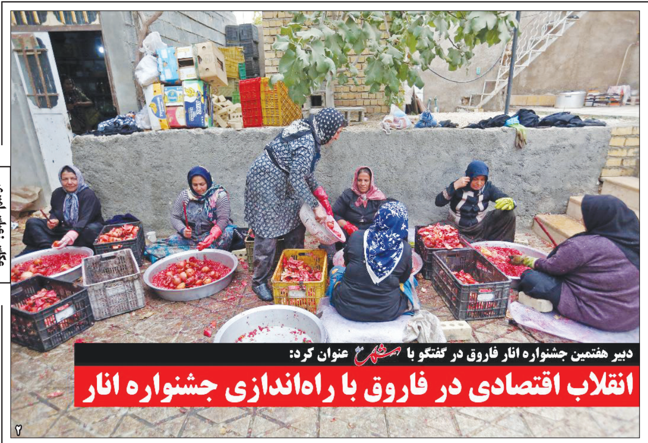
دبیر هفتمین جشنواره انار فاروق در گفتگو با مشرق عنوان کرد: انقلاب اقتصادی در فاروق با راه اندازی جشنواره انار