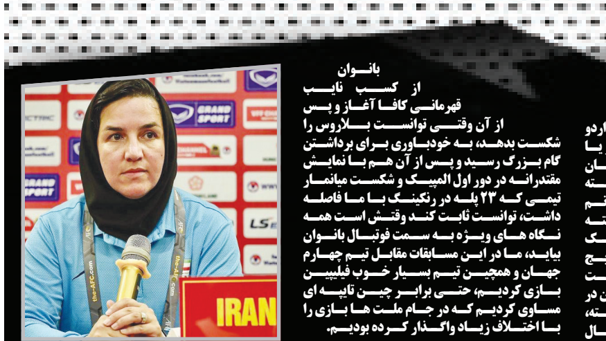
بانون از کسب نایب قهرمانی کافا آغاز و پس از آن وقتی توانست بزاروس را شکست بدهد، به خودباوری برای برداشتن جام بزرگ رسید و پس از آن هم با نمایان شدن ترانه در فور اول المپیک و شکست میانمار تیمی که ۲۲ بله در رنگینگ با ما فاصله داشت، توانست نایب قهرمانی است همه نگاه‌های ویژه به سمت فوتسال بانوان بیاید، ما در این مسابقات مقابل تیم چهارم جهان و همچنین تیم بسیار خوب فیلیپین بازی کردیم. حتی برابری چن تاچه ای مساوی کردیم که در جام ملت‌ها بازی را با اختلاف زیاد واگذار کرده بودیم.

ورزش ۱۳ | پس از بازی مقابل ساختار، جدای از شکستی که همچنان راهیابی بارسلونا به مرحله یک هشتم نهایی لیگ قهرمانان اروپا را به تأخیر انداخت و البته بازی وحشتناک آبی اتاری‌ها، مصدومیت رونالد آرنوئو نیز تگرانی‌ها را بالا برد. اولین معاینه پزشکی آسیب دیدگی جدی را رد می‌کند، اما او باید منتظر آزمایش‌های بیشتری می‌ماند. طبق ادعای رسانه‌های اسپانیا، حالا مشخص شده که مشکل آرنوئو گوئتی عضلانی است و او دچار پارگی عضله شده است. به این ترتیب با حداکثر ۲۶ یا ۲۸ ساعت استراحت، این بازیکن می‌تواند در تورنمنت گروهی شرکت کند. بنابراین خطری حضور او برای بازی یکشنبه مقابل آلاوز را نیز تهدید نمی‌کند.