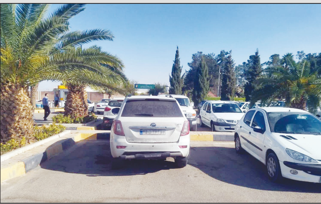
پارک نامناسب یک خودرو در محل پارک دو خودرو