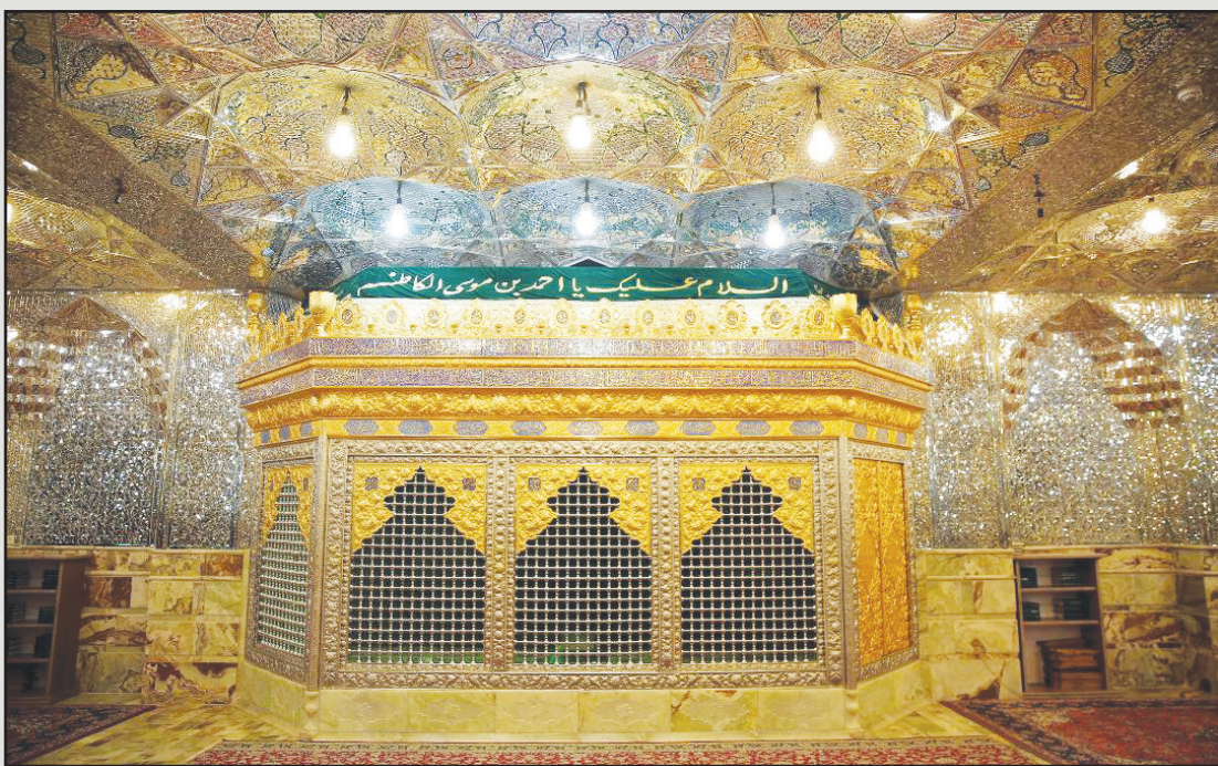
■ ضریح زیبای مضجع شریف حضرت شاهچراغ(ع) در طبقه سرداب حرم مطهر