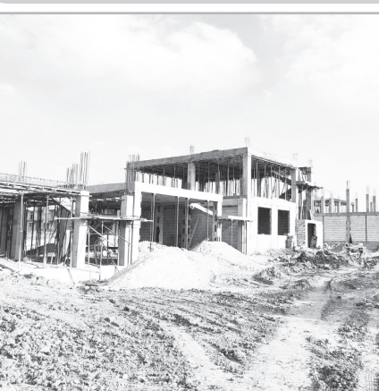
مدیرکل بنیاد مسکن فارس

وی، متذکر می شود: با تفکیک اجزاء پسماند های خشک در مبدا، تحویل مواد بازیافتی به ماشین های جمع آوری پسماند های خشک یا ایستگاه های ثابت بازیافت، طبق برنامه زمانبندی شده، فشرده سازی و کاهش حجم پسماند های خشک، عدم تحویل پسماند های خشک به دوره گرد ها، به دلیل مشکلات بهداشتی، تفکیک جداگانه پسماند های جزه، ویژه، جدید در حفظ منابع، سرمایه ها و محیط زیست و آموزش موارد مرتبط با تفکیک از مبدا زباله از طریق والدین به فرزندان مشارکت جدی داشته باشند.