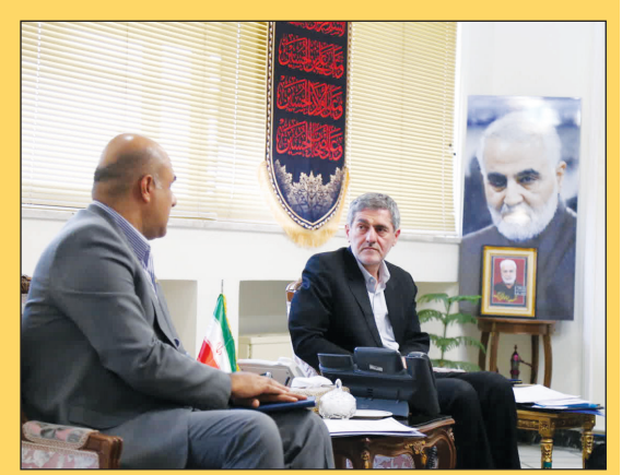
استاندار فارس در دیدار مدیر عامل شرکت مخابرات فارس:

ضرورت افزایش سرعت اینترنت در بسترهای مخابراتی مدیر کل راه و شهرسازی فارس: برای ثبت و تمدید اجاره نامه بصورت رایگان از سامانه املاک و اسکان استفاده کنید