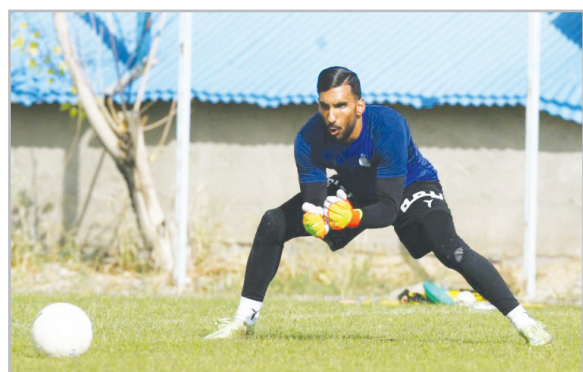
گلر استقلال: منتظر نظر باشگاه هشتم که بمانم یا بروم

روی کین، کارشناس فوتبال، می گوید دکلان رایس، خرید جدید آرسنال، ۱۱۵ میلیون یورو ارزش ندارد گزارش «ورزش سه»، روی کین، اسطوره منچستر یونایتد، در بخش زنده پیش از بازی کامیونیتی شیلد اظهار نظر تندی را علیه دکلان رایس بیان کرد. آرسنال در تابستان امسال برای جذب رایس از وستهام، ۱۲۱ میلیون یورو پرداخت کرد. آرسنال در رقابت با منچستر سیتی موفق شد رایس را جذب کند. این بازیکن ۲۴ ساله در دیدار برابر ستاره های ام اس و مناکو عملکرد مناسبی در ترکیب آرسنال به جای گذاشت و طرفداران از حضور او رضایت دارند اما کین، کاپیتان اسبق منچستر یونایتد، معتقد است که توپچی ها برای او پول زیادی داده اند و ادعا می کند که ارزش او بیش از ۱۰۰ میلیون یورو نیست و او که در ۱۷۷ پیش از بازی کامیونیتی شیلد صحبت می کرد، گفت: «آن ها برای او هزینه زیادی پرداخت کردند او مطمئناً بیش از ۱۰۰ میلیون یورو ارزش ندارد» سال اولین باری نیست که کین این هافبک را مورد انتقاد قرار می دهد، زیرا او در فصل گذشته از عملکرد این بازیکن ابراز تاسف کرد رایس ۶ فصل در وستهم بازی کرد و ۲۴۵ بازی برای این باشگاه انجام داد. پس از قهرمانی فصل گذشته لیگ کنفرانس اروپا با وستهم، او در باشگاهی که از کودکی در آن حضور داشت جدا شد و به آرسنال ملحق شد.