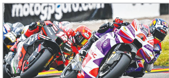
اسباز کارو فاتح دهمین گرندپری موتو جی پی فصل شد