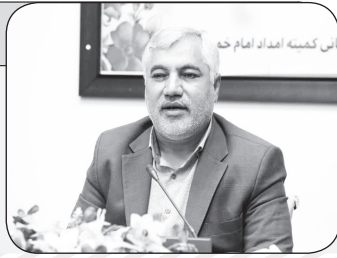
پس کتبه امداد امام حق