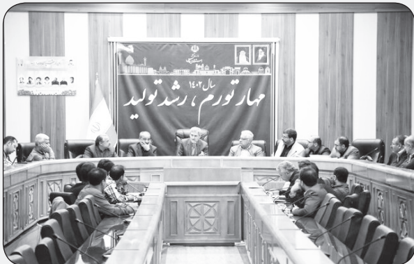
پاسخگویی نسبت به اقدامات خود بداندند.