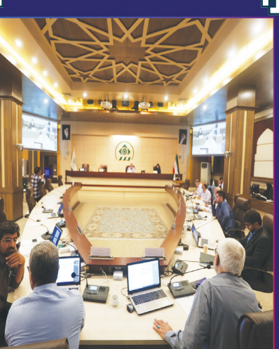
گزارش شهر مردم از یکشنبه و یستین جلسه صحن علنی شورای اسلامی نهر؛

از خط و نشان رئیس برای رسانه‌ها تا حضور مجدد دو عضو شورا که پرونده قضایی داشتند