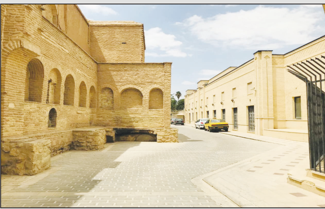
حفظ و ترمیم بخشی از بافت قدیم در جوار بین الحرمین شیراز