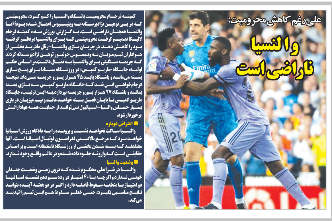
علی رستم کاهش محرومیت: والنسیا ناراضی است

کمیته فرجام محرومیت باشگاه والنسیا را گم کرد، محرومیتی که در پی توهمین نزادپرستانه به ونیسوس اعمال شده بود! اما والنسیا همچنان ناراضی است. به گزارش «ورزش سه»، کمیته فرجام لالیگا تصمیم گرفت محرومیتی که برای والنسیا در نظر گرفته بود را کاهش دهد. در جریان بازی والنسیا-رئال مادرید بخشی از هواداران نیم میزبان به ونیسوس جونیسور توهمین نزادپرستانه کردند که جریمه سنگینی برای والنسیا به دنبال داشت. بر اساس حکم اولیه، جایگاه «مارسو کمپس» در ورزشگاه مستثنا برای پنج بازی بسته می ماند و باشگاه باید ۴۵ هزار یورو جریمه می داد. نتیجه فرجام خواهی این شد که جایگاه «مارسو کمپس» سه بازی بسته ماند و باشگاه ۲۷ هزار یورو جریمه پرداخت کرد. به این ترتیب، جایگاه «مارسو کمپس» تا پایان فصل بسته خواهد ماند و تیم میزبان در بازی بسیار حساس والنسیا-اسپانیول نمی تواند از حمایت همه هواداران منتظر بماند. اعتراض دوباره والنسیا ساکت نخواهد نشست و پرونده را به دادگاه ورزش اسپانیا خواهد برد که مرجع بالادستی فدراسیون فوتبال اسپانیا است. آنها معتقدند که بسته شدن بخشی از ورزشگاه ناعرفانه است و بر اساس حقایقی است که وارونه جلوه داده شده و در عالم واقع وجود ندارد. وضعیت والنسیا والنسیا در شرایطی محکوم شده که درون زمین وضعیت چندانی خوبی ندارد و اگر چه با ۴۰ امتیاز در رده سیزدهم نشسته اما تنها دو امتیاز با منطقه سقوط فاصله دارد و اگر در دو هفته آینده نتواند نتایج مناسبی بگیرد، حتی خطر سقوط هم برای این تیم را تهدید می کند.