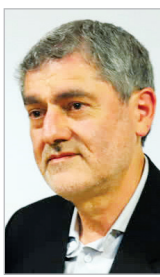
استاندار فارس خطاب به دانشجویان بسیجی: