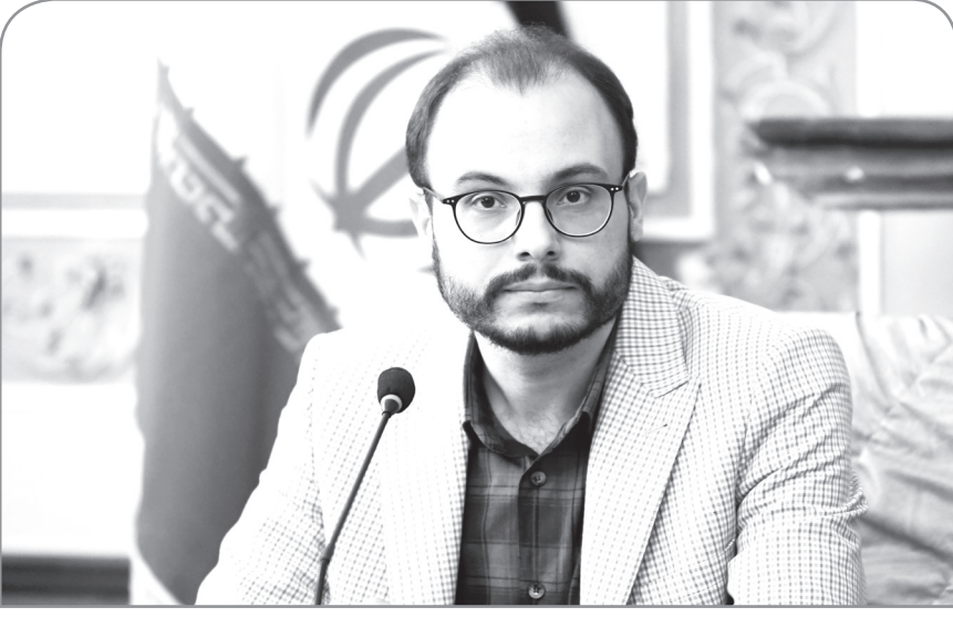
و... تدارک دیده شده است. رئیس اداره ارتباطات و حوزه برنامه ریزی اداره کل ارتباطات و امور بین الملل شهرداری

اصفهان با بیان اینکه مطابق با هندسه حرکت این اداره کل، در هر بازه زمانی ۱۵ روزه یکی از محورهای مهم فعالیت مدیریت شهری به شهروندان معرفی می شود، تصریح کرد: طراحی پیوست کامل رسانه های و بهره گیری از تمامی ابزارهای رسانه های شامل خبر، رویداد شهری، تولیدات مکتوب و چندرسانه ای و توزیع گسترده آنها موجب می شود شعاع تاثیر فعالیت های رسانه ای افزایش یافته و شهروندان، حداقل مخاطب یکی از این پیام ها قرار گرفته و مفهوم مورد نظر را دریافت کنند.