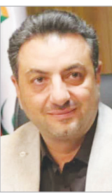
معاون حمل و نقل و ترافیک شهرداری شیراز مطرح کرد: