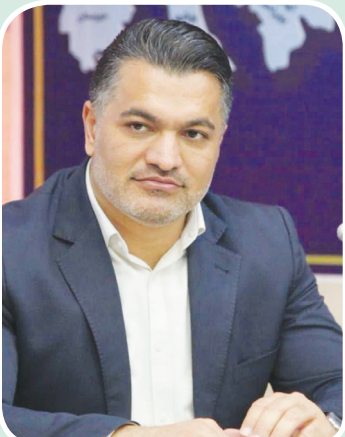
استان برگزاری یک نمایشگاه است که این ظرفیت ها را ارائه و معرفی کنیم.

گردشگری تلاش می کنیم، چرا که صنعت گردشگری از صنعت نفت و دیگر صنایع در دنیا پیشی گرفته است. وی ادامه داد: معرفی جاذبه ها و هدفمند شدن صنعت گردشگری را در سیزدهمین نمایشگاه بین المللی پارس دنبال خواهیم کرد. مدیرعامل سازمان همیاری شهرداری های فارس خاطرنشان کرد: به سهم خود دین ما را با ایجاد ایده های نو و رونق کسب و کار در نمایشگاه گردشگری پارس ادا خواهیم کرد.