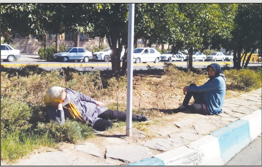
اندرو احوالات همراهان بیمار و وعده‌های بی سرانجام (بلوار زند شیراز)